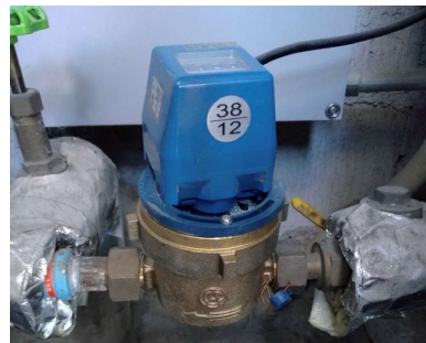
1棟メーター現況写真