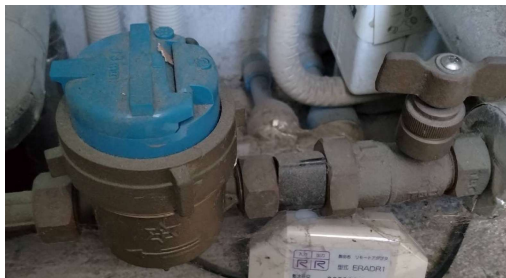
2棟メーター現況写真