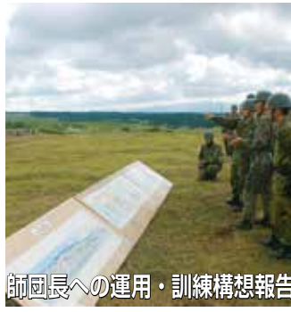
師団長への運用・訓練構想報告