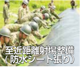
至近距離射撃整備 (防水シート張り)