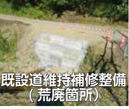
既設道維持補修整備 (荒廃箇所)