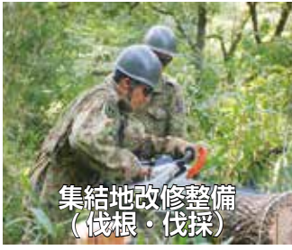
集結地改修整備 (伐根・伐採)