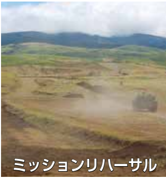
ミッションリハーサル