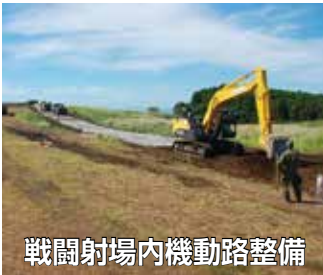
戦闘射場内機動路整備