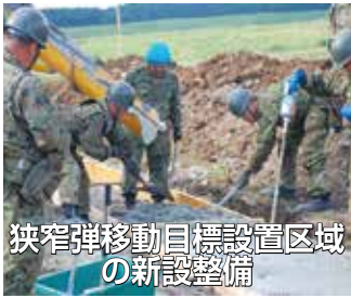
狭窄弾移動目標設置区域 の新設整備