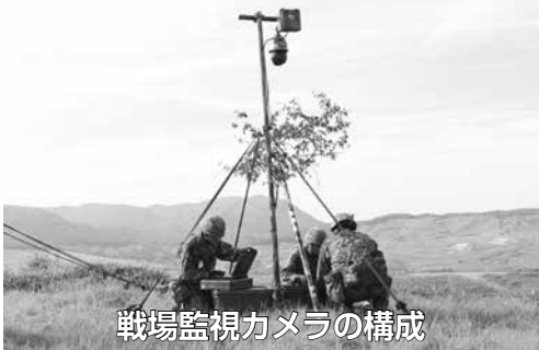
戦場監視カメラの構成