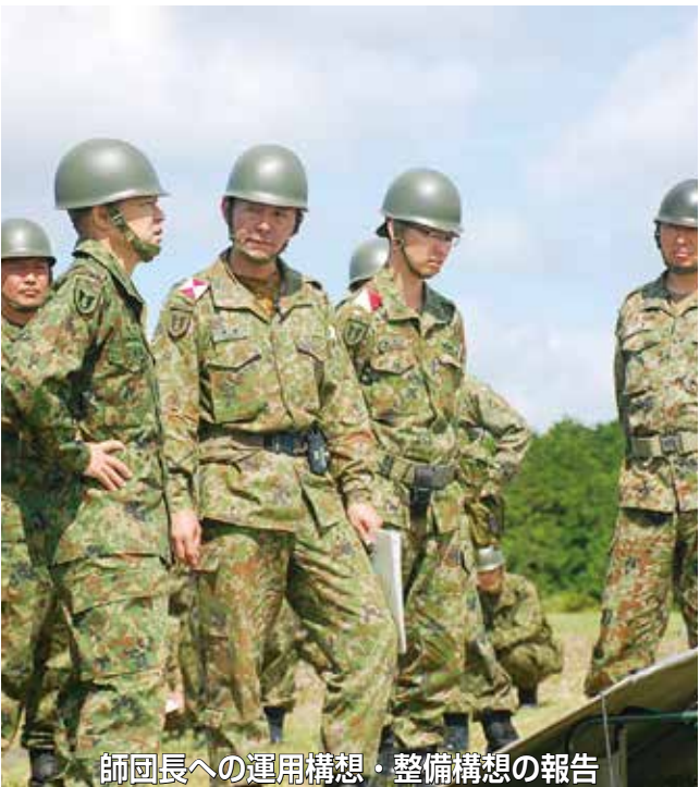
師団長への運用構想・整備構想の報告