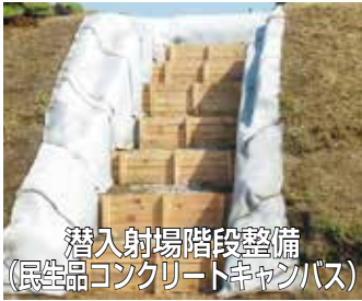
潜入射場階段整備(民生品コンクリートキャンバス)