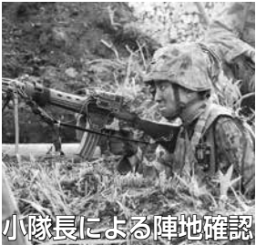
小隊長による陣地確認