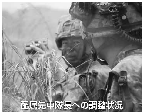
配属先中隊長への調整状況