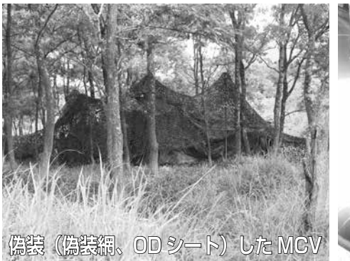
偽装 (偽装網、ODシート) した MCV