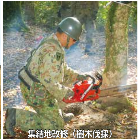
集結地改修(樹木伐採)