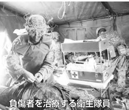
負傷者を治療する衛生隊員