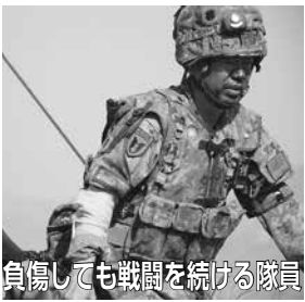
負傷しても戦闘を続ける隊員