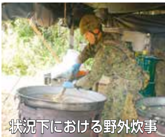
状況下における野外炊事