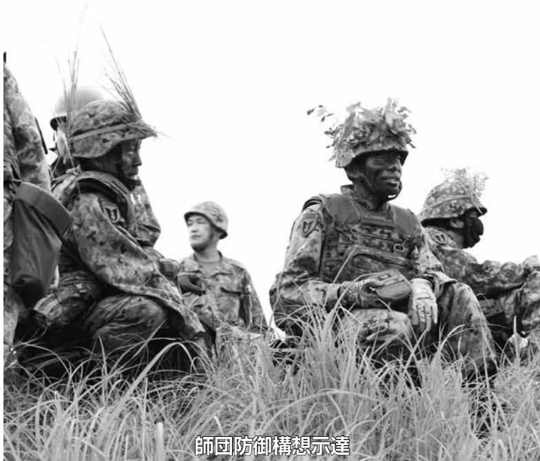
師団防御構想示達