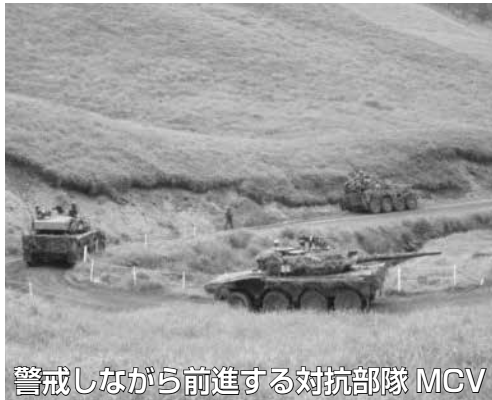
警戒しながら前進する対抗部隊 MCV