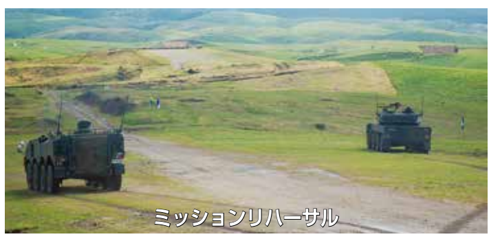
ミッションリハーサル