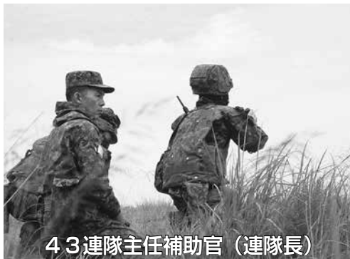
43連隊主任補助官 (連隊長)