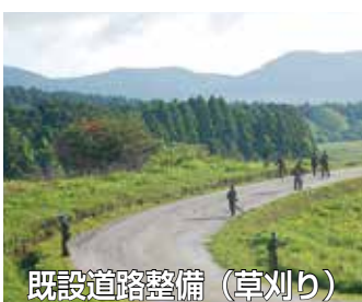
既設道路整備(草刈り)