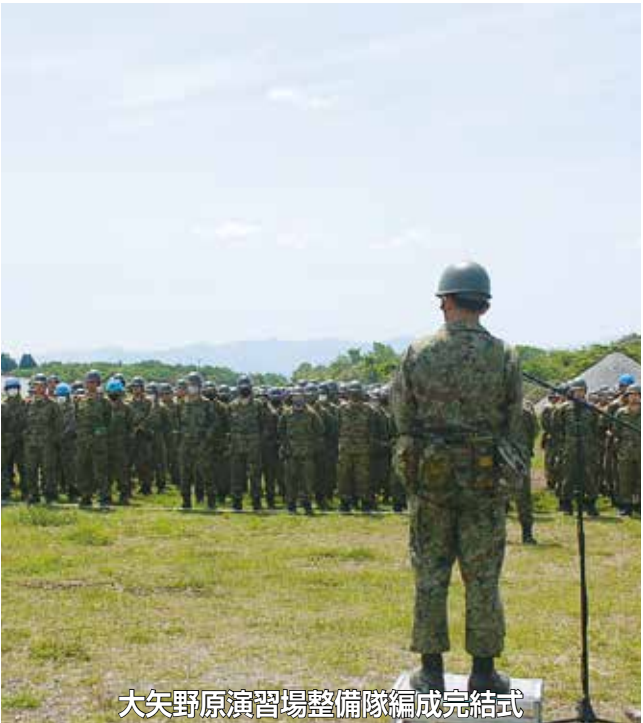
大矢野原演習場整備隊編成完結式