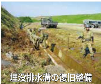
埋没排水溝の復旧整備