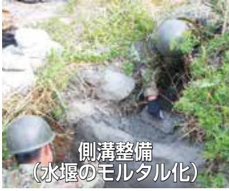
側溝整備(水堰のモルタル化)