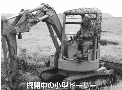
掘開中の小型ドーザー