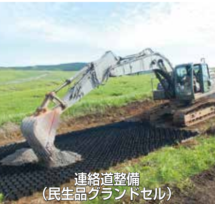
連絡道整備(民生品グランドセル)