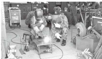
整備教育 (溶接作業)