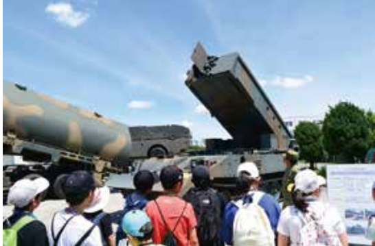
駐屯地見学会 令和6年7月25日(木)