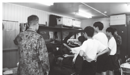
運転シミュレーション