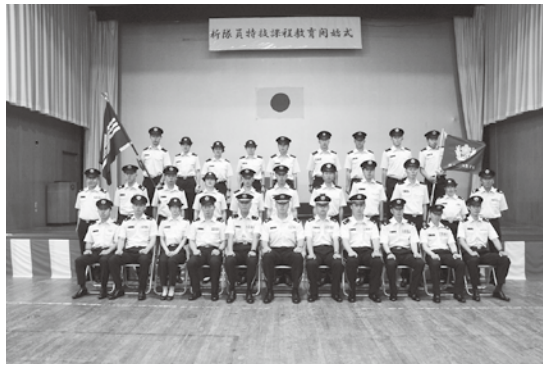
新隊員後期開始式（集合写真）

第2施設群長は、訓示におい て「あらゆる状況を克服し、生 き残り、任務を継続せよ」と要 望し、各級指揮官はそれぞれの 地位、責任と権限及び当面する 状況を踏まえ、上級部隊指揮官 から受領した命令を具現化して 指揮下の隊員に徹底せよと述べ ました。