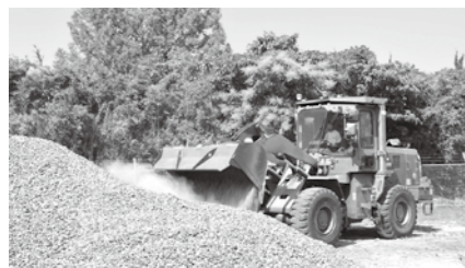
バケットローダ体験操縦