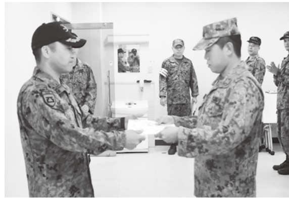
優勝チームの賞状授与