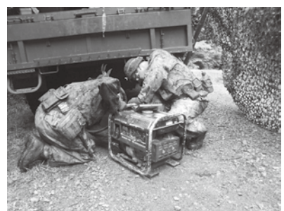
発電機整備(2中隊派遣隊)