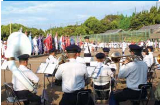
第1回 SummerCup 争奪福岡大会 令和6年8月24日(土)