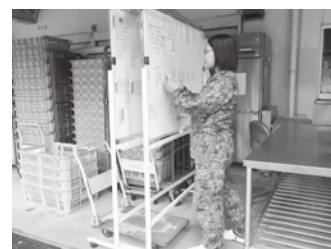
納品のチェック中 (検収作業)

令和6年8月に第8普通科連隊(米子駐屯地)から業務隊に異動してきました。最初は、育児休業のプランクがあり、初めての異動、初めての職務で不安は募るばかりでしたが、業務隊の皆さんに温かく迎えていただき、新しい職務に対する不安もゆっくりと解決していききました。これからも家族と仕事を両立しながら、部隊に貢献できるように頑張ります。