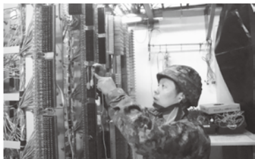
駐屯地内の内線構成