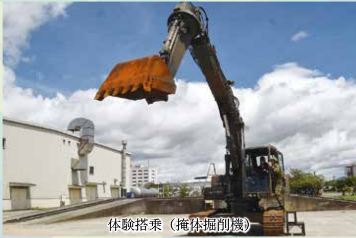
体験搭乗（掩体掘削機）