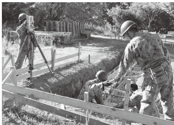
型枠の設置（健軍駐屯地東側地区）

隊は、8月27日から8月29日までの間、日出生台演 習場において、#3隊野営訓練を実施しました。 隊野営訓練では、架橋中隊が、被支援部隊である高 射特科部隊（竹松駐屯地）のニーズに合わせたレジリ エンス（部隊防護）確保に係る構築物を構築する等、 状況判断に基づく施設支援を実施し、施設技術を更 に向上させました。 また、7月1日から、健軍駐屯地東側地区において 訓練棟（射撃訓練シミュレータ）新設工事等特殊器材 中隊が担任しています。本工事は2年計画で、現在基 礎工事を実施しています。 隊は今後も特有の技術を駆使して、様々な任務に一 丸となって対応してまいります。