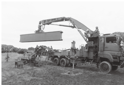
第368施設中隊検閲 （07式機動支援橋）