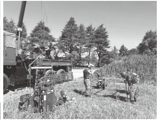
自作したボーリング足場の構築