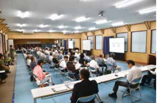
小郡市自衛隊協力会総会支援 令和6年7月23日(火)