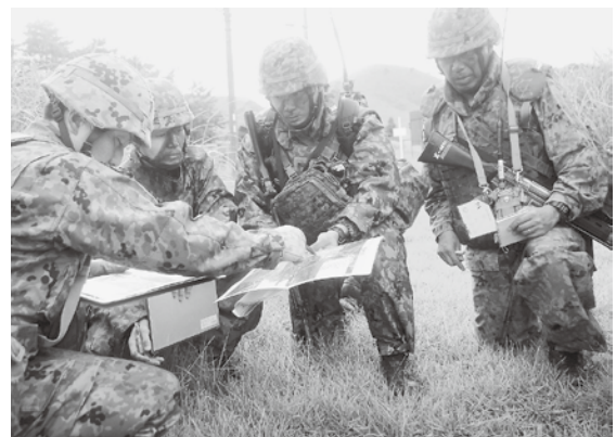
高射特科部隊との現地調整 （日出生台演習場）