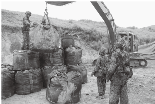
第4次中隊練成訓練