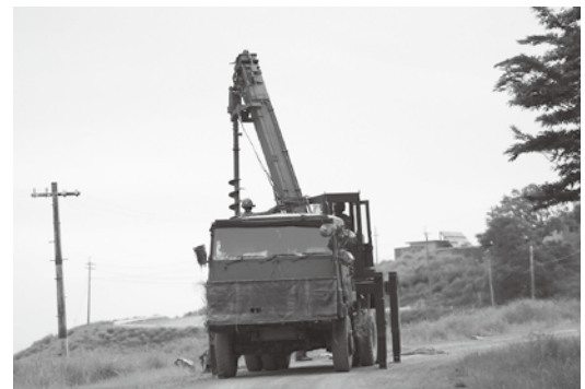
第367施設中隊検閲 （道路障害作業車）