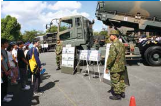
陸自ジョブリンピック支援 令和6年8月26日(月)