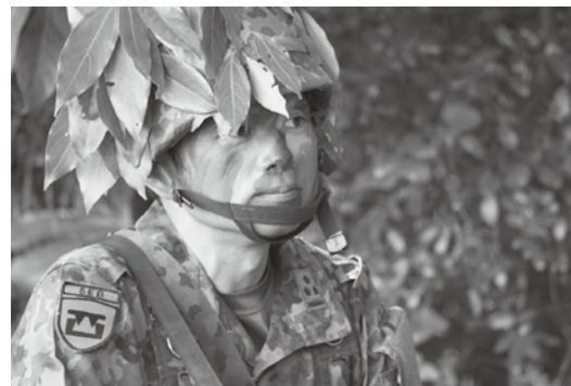
第401施設中隊検閲 （中隊長現場指導）

群は、令和6年7月3日に令 和6年度新隊員特技課程「施設」 教育開始式を実施しました。 夢と希望を抱き、一人前の施 設科隊員を目指し、必要な知識 と技能を修得していきます。 約3カ月の教育になります。基 幹要員を核とし、課程教育 を実施中です。