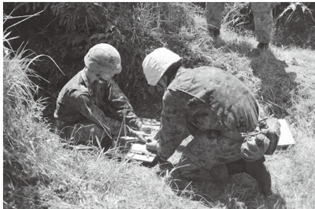
起爆準備を行う隊員