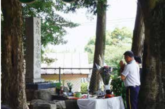
高卒塔婆慰霊祭 令和6年8月6日(火)