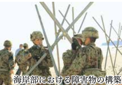
海岸部における障害物の構築