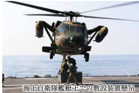
海上自衛隊艦艇上での敷設装置懸吊