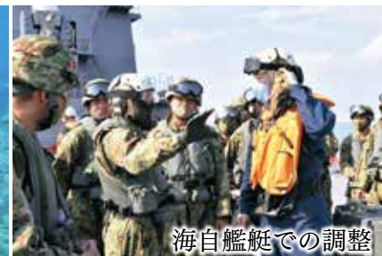
海自艦艇での調整