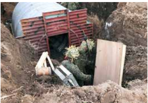
第391施設中隊訓練検閲 (日出生台演習場)