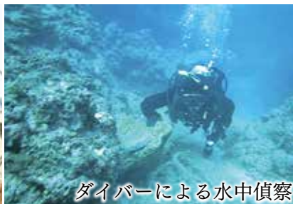
ダイバーによる水中偵察