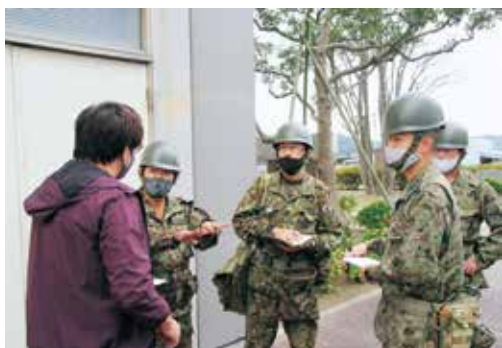
関係機関との調整

群は、令和2年11月25日から7日までの間、宗像市で発生した福岡県初の鳥インフルエンザに係る災害派遣に、群長以下112名が活動しました。現地での活動においては、群長の要望事項である「地域住民のためにより仕事をしよう」「事故なく怪我なく安全に帰隊しよう」を胸に刻み、養鶏場で飼育されていた全9万羽あまりの鶏の処分を終了し、一件の事故もなく任務を完遂しました。