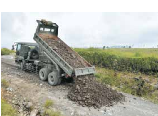
日出生台演習場定期整備 （作業現場での卸下）

中隊は、令和2年10月23日から11月6日までの間、02鎮西演習（方面隊実動演習）に参加しました。この間、水際障害隊の一部として、水際地雷原構成の練度向上、特に海上自衛隊及び西部方面航空隊と協同し、輸送艦上でヘリコプター用水際地雷敷設置の懸吊訓練を行い、事態対応能力を向上させました。