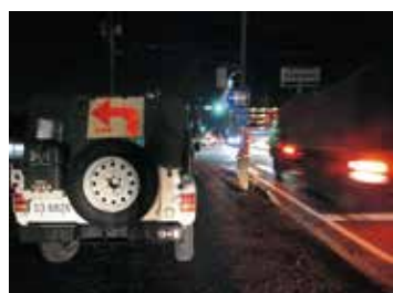
道路交通統制（第2師団部隊到着）

駐屯地の皆様のおかげで無事に新年を迎えることができましたことを感謝申し上げます。警務隊のあるべき姿を追求し、駐屯地隊員の皆様の事件がないうように防犯活動を実施し、万一、事件・事故が発生した際は速やかに捜査を行い、部隊のために貢献して参りますので、今年も皆様のご協力の程、宜しくお願い申し上げます。