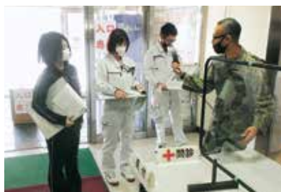
事務官等交叉訓練（緊急登庁支援）