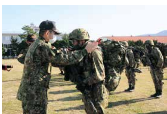
レンジャー帰還式

現在、施設の撤収を実施中ですが、最後まで気を緩めることなく、引き続き任務完遂に邁進していきます。