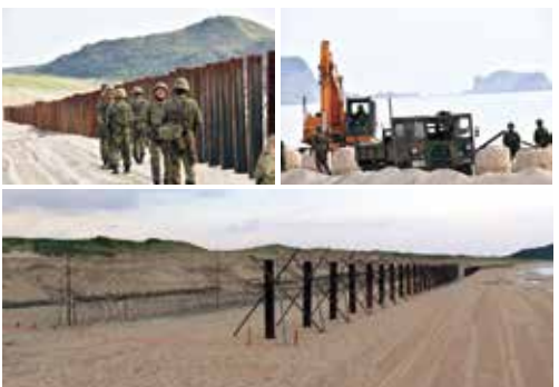
汀線部障害構成 (種子島)

群は、令和2年10月23日から11月6日までの間、種子島及び徳島において、02鎮西演習(方面隊実動演習)に参加し、全国の水際障害中隊等を編成した水際障害隊を編成して、生地での訓練を実施しました。本訓練において、第391施設中隊は、施設技術を最大限に発揮し、海岸に正面幅500メートルもの汀線部障害を構成しました。引き続き、11月16日から20日までの間、第391施設中隊は、日出生台演習場にて中隊訓練検閲を受閲し、陣地構築等の任務を完遂しました。