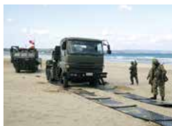
敷板を活用した回収訓練