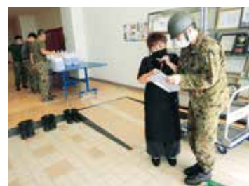
民間事業者との調整

謹んで新年のお慶びを申し上げます。昨年は、新型コロナウイルス発生により生活様式が一変されました。当隊も給与・旅費システムの新規導入により、業務要領が変化したものの、これまで以上に駐屯地部隊のため会計支援に努めてまいりますので、皆様のご協力の程よろしく申し上げます。