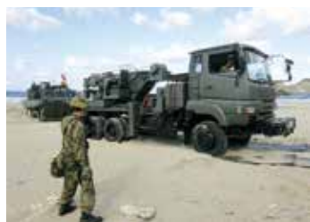
重レッカによる回収