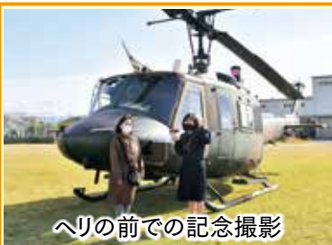
ヘリの前での記念撮影

とても楽しみにしていたので、気候に恵まれて良かったです。ヘリの機体が安定した飛行だったので、安心して乗ることができました。災害時にはこのヘリから救助を待つ人を発見するのかもしれない、つくづく大切な仕事をされているのだなと感じました。中学生の娘と一緒に体験してくれましたが、将来この経験が何かの役に立つことと思います。ありがとうございました。