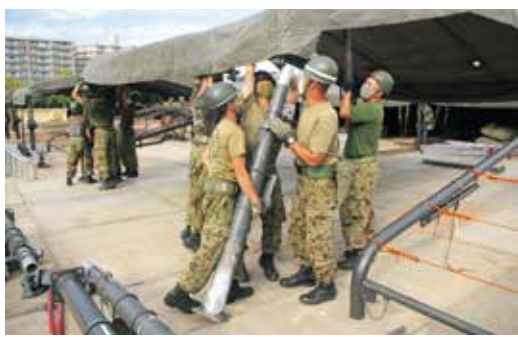
整備所用天幕の支柱の設置

本年も全ての隊務を作戦と捉え、即応態勢を維持しつつ、任務を完遂できる強靱な部隊の育成に尽力していきま