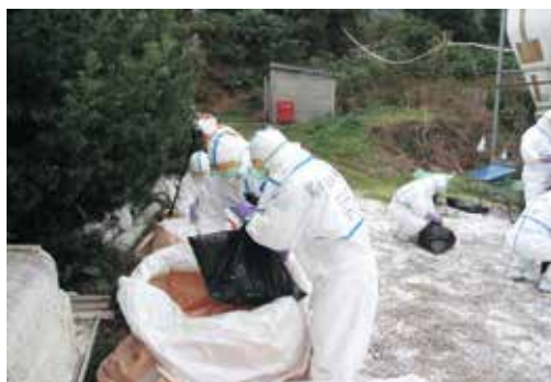
防疫作業に従事する隊員