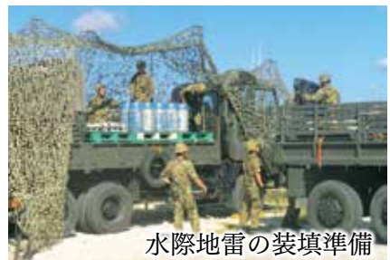
水際地雷の装填準備