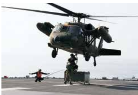
輸送艦上でのヘリコプター用 水際地雷敷設置の懸吊訓練

昨年は新型コロナウイルス感染症の流行という世界的に大きな出来事があり、世界はいまだその影響下にあります。そのようなコロナ禍ではあります。引き続き本年も、即応態勢を維持しつつ、更なる水際障害中隊の精強化、第9施設群との連携強化に努めて参りますので変わらぬご指導、ご鞭撻をお願いして新年の挨拶といたします。