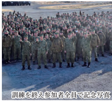
訓練を終え参加者全員で記念写真