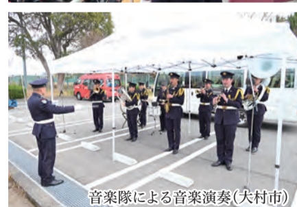
音楽隊による音楽演奏(大村市)

第16普通科連隊は、令和8年1月5日(月)から令和8年1月10日(土)までの間、長崎県内各地において消防出初式支援を行った。 南島原市の出初式では、らっば隊による演奏支援、島原市・大村市・諫早市では音楽隊による演奏支援を行い、県内各地の消防出初式に花を添えた。 各消防隊からは、「ありがとうございます。」と労いの言葉をいただいた。