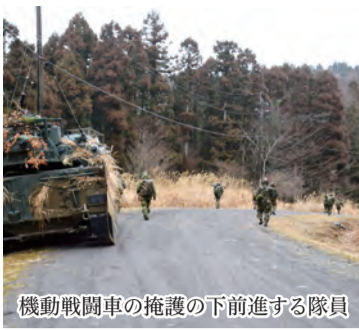
機動戦闘車の掩護の下前進する隊員