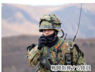
戦闘指揮する隊員