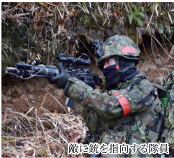
敵に銃を指向する隊員