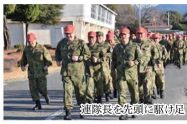
連隊長を先頭に駆け足