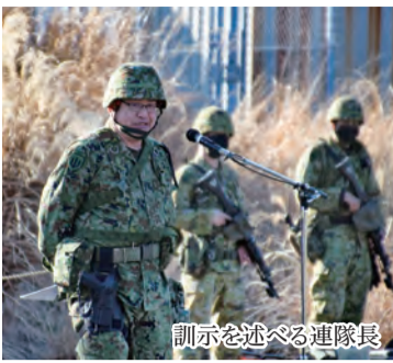
訓示を述べる連隊長