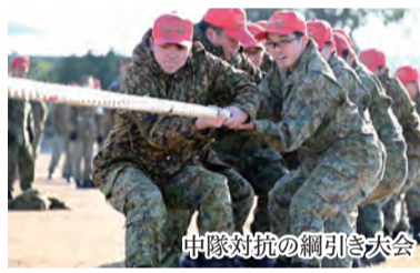
中隊対抗の綱引き大会