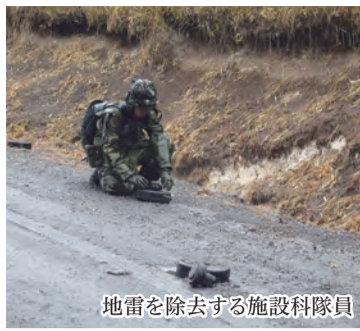
地雷を除去する施設科隊員