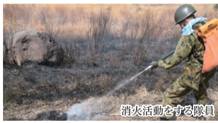
消火活動をする隊員