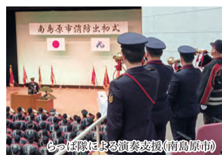
らっば隊による演奏支援(南島原市)