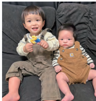
第16普通科連隊 本部管理中隊 大楠3曹 第4施設大隊 本部管理中隊 大楠(琉)土長 次男 晴(はる)くん 令和6年12月14日生

誤字・脱字等不備がございましたら深くお詫び申し上げます。読み終わったら、周りの人にも見せてください。