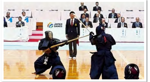
一戦一戦の積み重ねが技術と精神の成長につながり、次なる目標を見出すことが出来ました。

銃剣道訓練隊は、日々の勤務と並行しながら限られた時間を最大限に生かし、効率的かつ質の高い練習を続けています。また隊員たちは様々な大会に参加し、実践の場を通して、自らの技量を客観的に確かめることも、次なる成長に向けた課題を見出し、厳しい環境下で積み重ねる鍛錬は、技術だけではなく心身の鍛錬にもつながります。銃剣道訓練隊は今後も文武両道を掲げ、精進を重ねながら、さらなる高みを目指して挑戦を続けていきます。