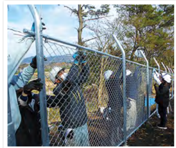
今年度で300mが完成しました。業務隊も、十文字演習場の整備の一翼を担っています！

本整備は、演習場に隣接する茶畑への害獣被害を防止し、長期安定使用に資することを目的として、令和5年度から毎年100mずつ、業務隊が自隊施工で実施しています。寒風吹きさらし中での作業でしたが、工事3年目となり、職員の練度も年々向上し、まるで業者が実施する工事と同程度の完成度となりました。