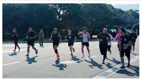
会計隊が一丸となって実施することで、きつい練成も笑顔で乗り越えて頑張れました。