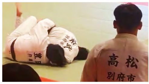
昨年は県民スポーツ大会にも参加をしました。試合を通じ一人ひとりが課題を見つけることが出来ました。

柔道訓練隊は、現在、少人数での活動となっており、部員が揃う貴重な時間を最大限に活かして技術の向上を目標とし、短期集中的に寝技・立技の基礎から応用まで稽古を行っています。環境が整わない中でも、隊員一人ひとりが自己研鑽を怠らず、確かな力を積み重ねて、互いに切磋琢磨し、一丸となって頑張っています。今後の目標は、練習態勢の強化、各大会入賞はもちろんですが、新たな部員の確保にも力を注ぎ、訓練隊としての活動の幅を広げていきたいと考えています。