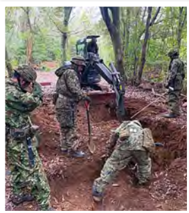
身を守るための大きな穴をみながら一生懸命掘っている様子です。

今回の訓練を通じて、課題を見出すことができ、事後の訓練に反映することができたと感じます。