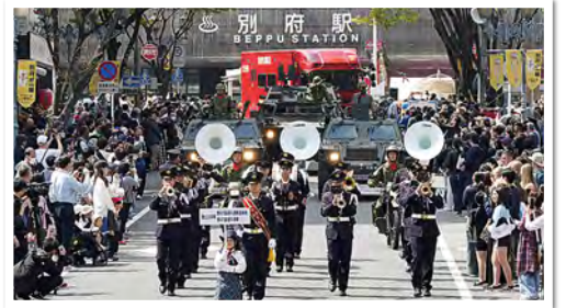
別府を中心とし、様々なイベントに参加させていただいているのも、地域の皆様のご理解、ご協力があったことと深く認識しております。

連隊音楽部は、昭和53年5月に発足し、現在14名で編成され、大分県下を中心に演奏活動を行っています。年間の主な活動は、駐屯地での式典、儀礼演奏をはじめ、別府大分毎日マラソン等、各市町村でのイベント演奏など内外合わせて年間約50回の演奏活動を行っています。これからは市民の皆様と自衛隊との架け橋となるよう日々練習に励んでまいります。また演奏の幅を広げるためには、人員の増加が必要不可欠です。新たな部員の確保にも力を入れてまいります。