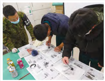
警察官がするような指紋採取を体験してもらい、陸上自衛隊の職域の幅の広さを感じてもらいました。

また、9日(火)には、職種紹介として中津市所在の高校生5名に対し、職種説明及び指紋採取体験を実施し、今後の募集活動及び警務官の獲得に貢献した。