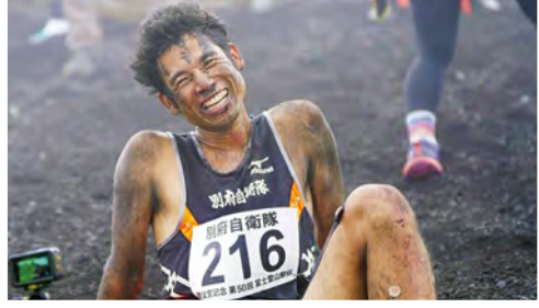
過酷なコンディションの富士登山駅伝。完走した喜びと達成感、この泥にまみれた笑顔が何よりの証拠です。