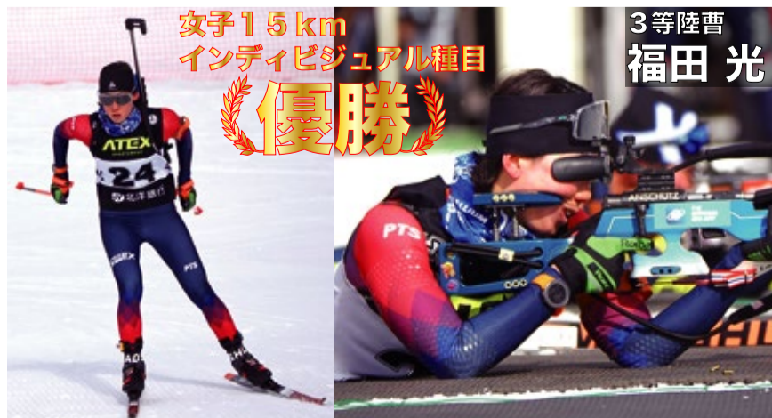
女子15km インディビジュアル種目 優勝