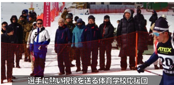
選手に熱い視線を送る体育学校応援団

選手達の戦いは、いよいよ今季最後のレースである第62回バイアスロン日本選手権大会及び天皇杯第104回全日本スキー選手権大会へと続く。