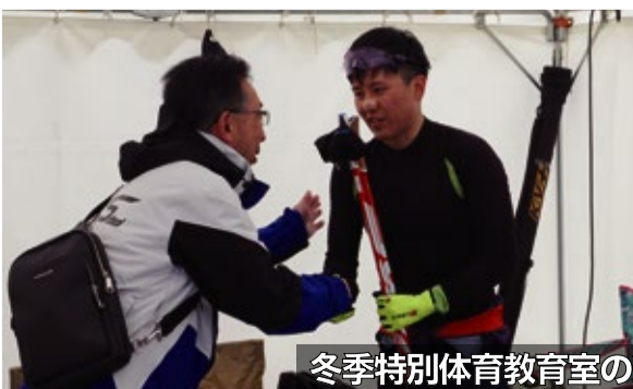
冬季特別体育教育室の選手を激励する学校長