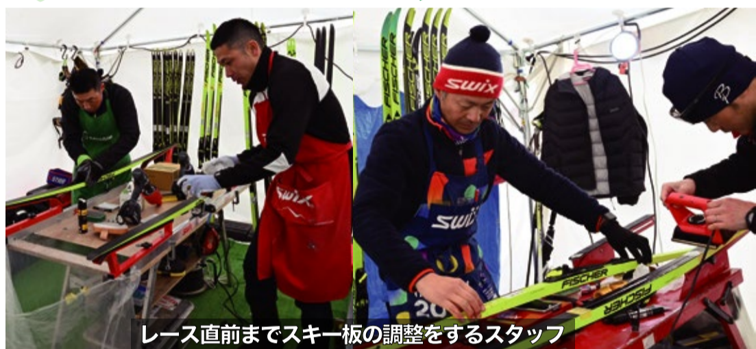
レース直前までスキー板の調整をするスタッフ

選手が全力で競技に集中するためにはスタッフのサポートが必須である。朝早くから選手の板をメンテナンスするスタッフは、当日の気温、雪温だけでなく、選手とコミュニケーションを取り、選手一人一人の要望やコンディションなどを考慮しワックスを塗り選手をスタートへと送り出す。選手とスタッフとの信頼関係がなければ成立しない冬季種目。スタッフは元選手だからこそ選手に寄り添ったサポートができる。優勝した山下2曹がレース後、スタッフにお礼を言って握手をするシーンは、個人の努力だけではなく、チームとして勝ち取った優勝を印象付けるシーンだった。