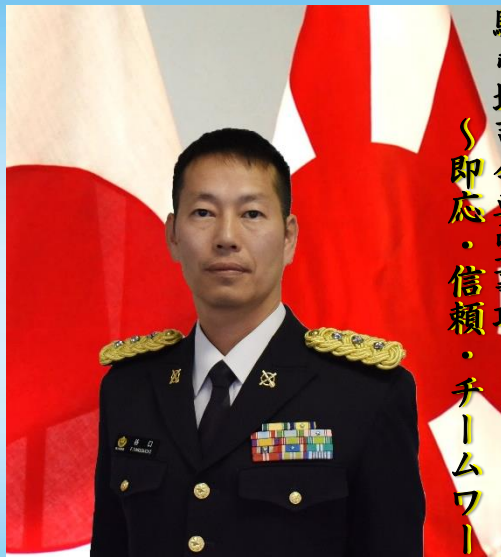
第4地对艦ミサイル連隊長 兼ねて八戸駐屯地司令