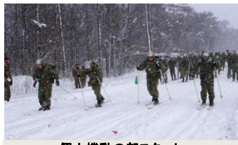
個人機動の部スタート