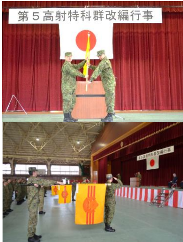
第5高射特科群改編行事

令和7年度3月24日(月)八戸駐屯地において第5高射特科群長は03式中距離地对空誘導弾(通称・中SAM)の導入に伴い群改編行事を実施した。今後は中SAMの能力を最大限に発揮し、あらゆる任務に対応出来るよう、群一丸となって訓練に邁進して参ります。