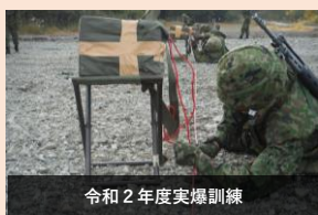
令和2年度実爆訓練