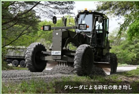
グレーダによる碎石の敷き均し