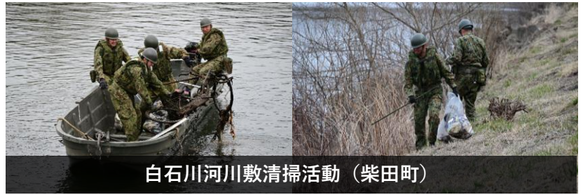
白石川河川敷清掃活動（柴田町）

3月16日、柴田町の白石川河川敷清掃活動に第312ダンプ車両中隊が、3月23日、丸森町の阿武隈川清掃美化運動に第104施設器材隊がそれぞれ参加しました。