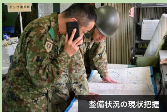
整備状況の現状把握