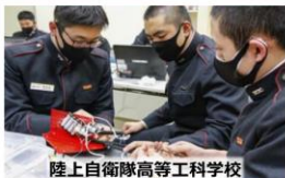
陸上自衛隊高等工科学校