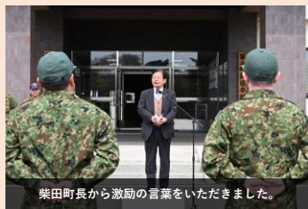
柴田町長から激励の言葉をいただきました。

任務を終え無事帰国した隊員達は安堵の表情を浮かべ、また任務完遂の喜びを嘯みしめていました。