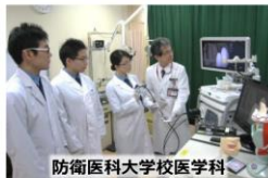
防衛医科大学校医学科