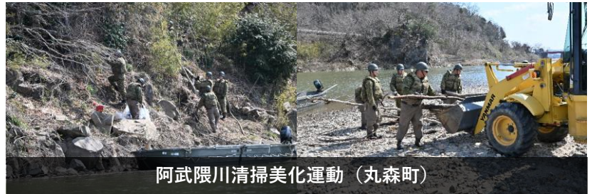
阿武隈川清掃美化運動（丸森町）

河川敷のゴミを直接回収するとともに渡河ポートを用いて、徒歩では入りづらい川岸の流木や粗大ゴミなどを回収し、地域の美化に貢献しました。