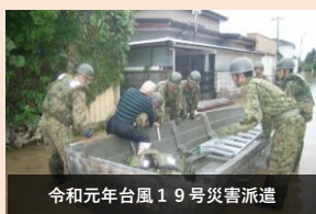
令和元年台風19号災害派遣

第386施設中隊は平成22年、「障害処理能力」を強化した中隊として誕生し、以来有余年、災害派遣や国際平和協力活動、部外工事等、様々な任務を完遂し、第10施設群の中核部隊として第2施設団の活動を支えました。