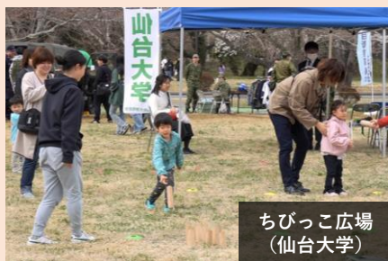
ちびっこ広場 (仙台大学)