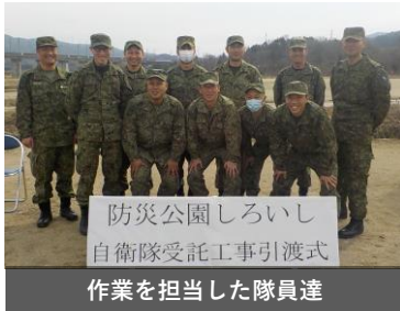
防災公園しろいし 自衛隊受託工事引渡し式 作業を担当した隊員達

第10施設群が中心となり令和6年4月から約1年間、日頃の訓練で培った施設技術力を発揮して、防災公園しろいし建設予定地の敷地造成を行いました。