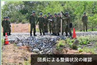
団長による整備状況の確認