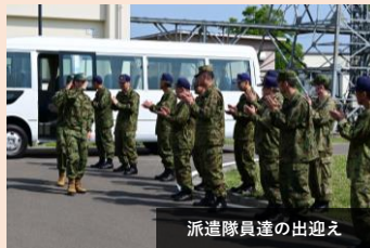
派遣隊員達の出迎え