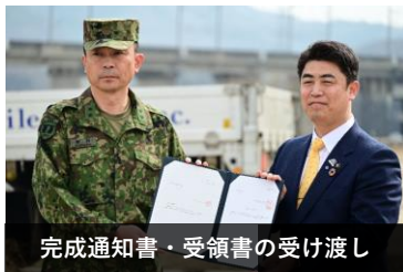
完成通知書・受領書の受け渡し