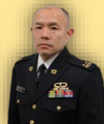
船岡駐屯地業務隊長