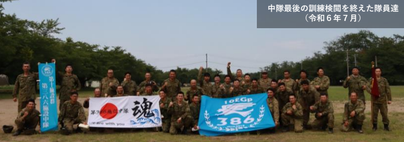
中隊最後の訓練検閲を終えた隊員達 (令和6年7月)