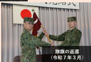
隊旗の返還 (令和7年3月)