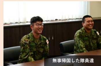
無事帰国した隊員達