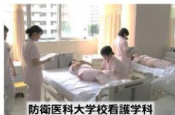
防衛医科大学校看護学科

防衛大学校学生・防衛医科大学校学生・高等工科学校生徒は、 特別職国家公務員として、一般の学校と同じ教育に加え、防衛に関する知識を学び、自衛官としての素養を磨いています。