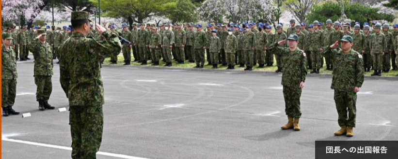
団長への出国報告

船岡駐屯地は、4月18日、パプアニューギニアで実施された「プクプク演習（工兵演習）」に参加する隊員2名の出国行事を行いました。