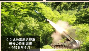
92式地雷原処理車 最後の投射訓練 (令和6年6月)