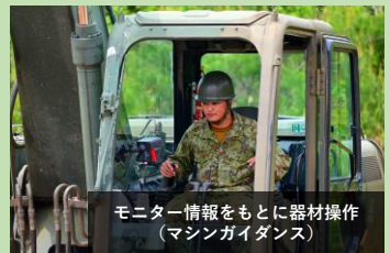
モニター情報をもとに器材操作 (マシンガイダンス)