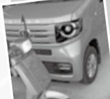
趣味の車とバイク

私の夫は、見慣れた顔なじみで、わりと私に予算を計上し、ウツドデッキを作ったり、お小遣いでバイクの塗装をしたり、この間は水漏れしたトイレのタンクを直してくれました。とても器用な人です。強面で近寄りたがりと思いましたが、話し出すととてもしゃべります。良くないところは本人にもいつか残念な所です。このことが二度とも落ち込んでいたことがありました。結婚当初は私も悲しくなりましたが、今は負けていません。夢と希望をいつも持っている人です。将来を語りだすと聞いている私まで楽しくなります。息子達が一人立ちするまでまだ少しありますが、大志を胸に仕事に趣味に邁進して下さい。