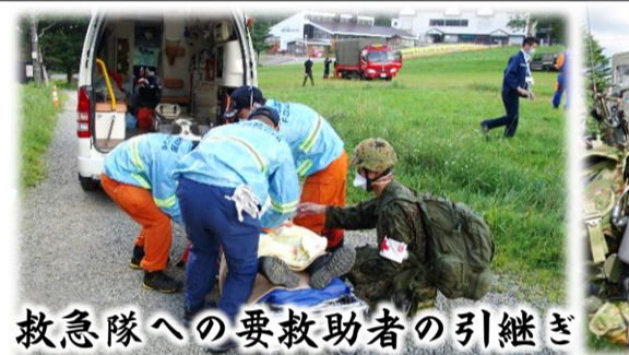
救急隊への要救助者の引継ぎ