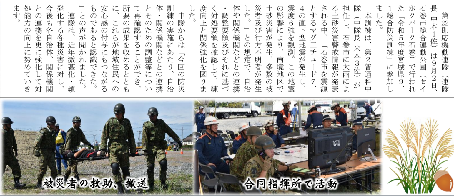
被災者の救助、搬送