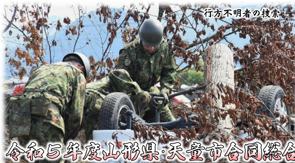
行方不明者の捜索

第6師団は、山形・宮城・福島3県において、各自治体が実施する防災訓練に参加しました。