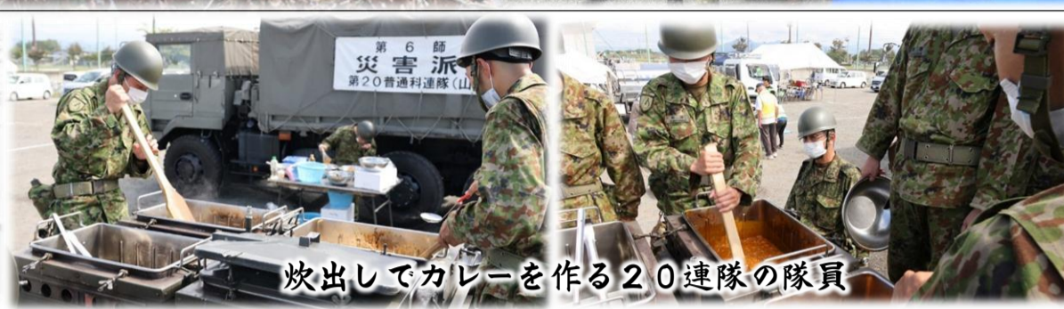
炊出してカレーを作る20連隊の隊員