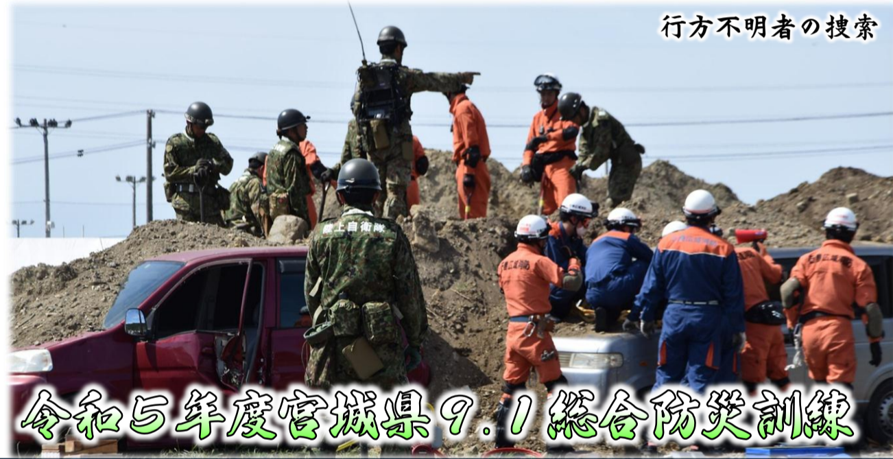
行方不明者の捜索