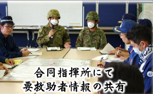
合同指揮所にて要救助者情報の共有