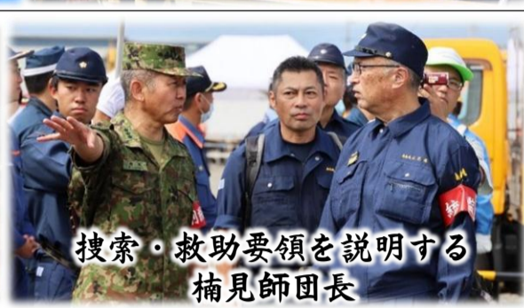
捜索・救助要領を説明する捕見師団長