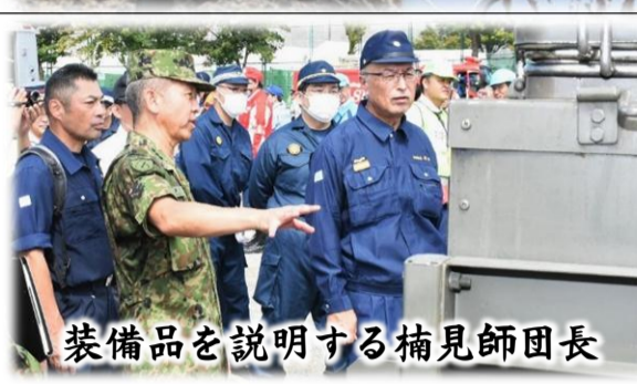
装備品を説明する捕見師団長