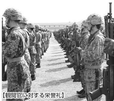
【観閲官に対する栄誉礼】