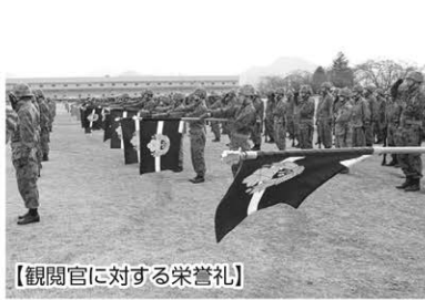
【観閲官に対する栄誉礼】