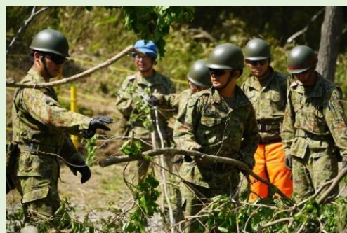
人力による樹木の除去