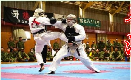
胴蹴りを決める本部管理中隊 朽木3曹