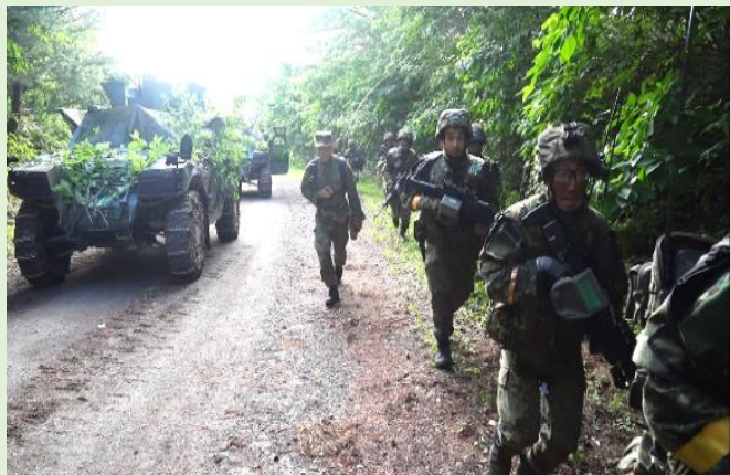
軽装甲機動車と共に連隊目標を奪取!