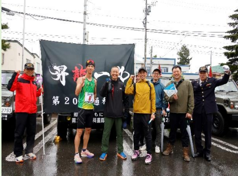
激励に訪れた連隊長、最先任、中隊長等と記念撮影