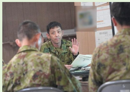
作業隊の運用を適確に指揮する第4科長 本木1尉