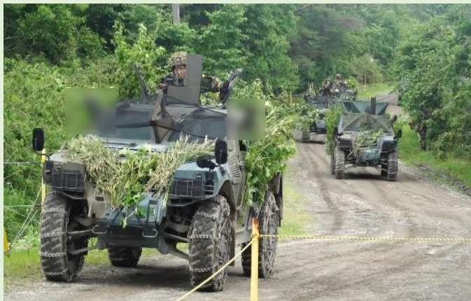
中隊必成目標を奪取する第4中隊