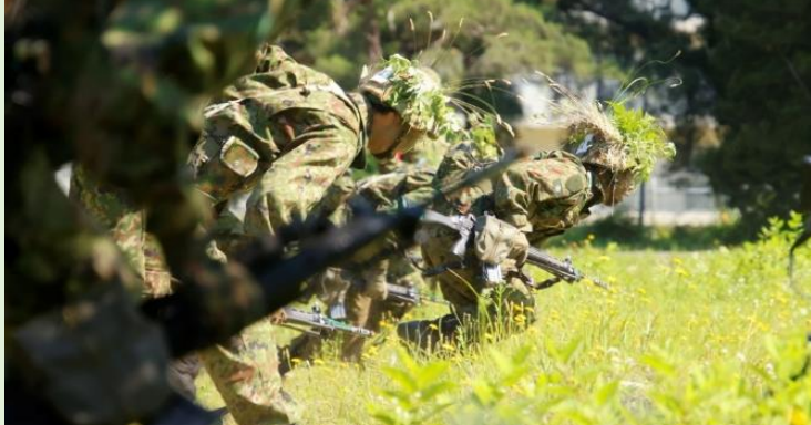
総合訓練（陣地攻撃）

4月に入隊して以来、自衛官として必要な資質を養うとともに、各職種共通の基礎的な知識・技能を修得するため、「自衛官候補生課程」（担任官・本部管理中隊長）に参加していた自衛官候補生は、約3カ月間にわたる教育を修了した。入隊以降、自衛官候補生は教官・助教の指導の下、資質面では、規律心、協調性、団結力の向上に努めるとともに、識能面では基本教練、小銃の分解結合、射撃、戦闘訓練や体力練成に積極的に取り組んできた。特に、教育課程の集大成として実施された、25キロ行進に引き続く戦闘訓練を行う1夜2日にわたる総合訓練では、疲労困憊の状況においても隊員一人一人が冷静・確実に行動し、同期の絆を大切にしながら互いに声を掛け合い、与えられた任務を見事に完遂した。