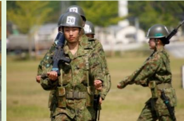
訓練評価（分隊教練）