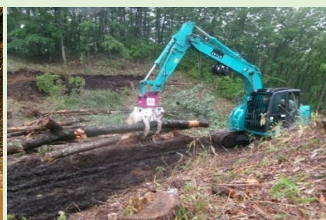
フェラーパンチャーを使用した樹木の運搬