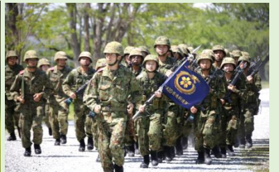
遅くも成長した自衛官候補生