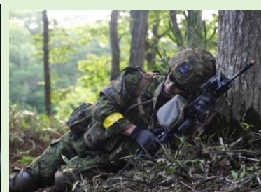
遮蔽物を活用し、戦闘する隊員