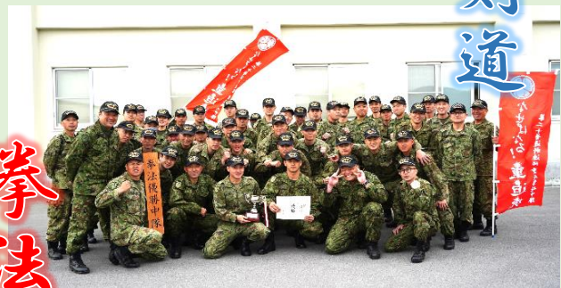
優勝した重迫撃砲中隊 (拳法の部)