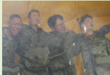
特殊武器防護（ガス体験）