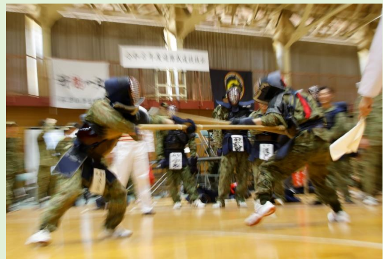
強烈な初一本! (銃剣道)