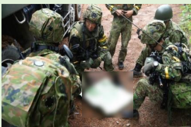
現地における命令の捕捉