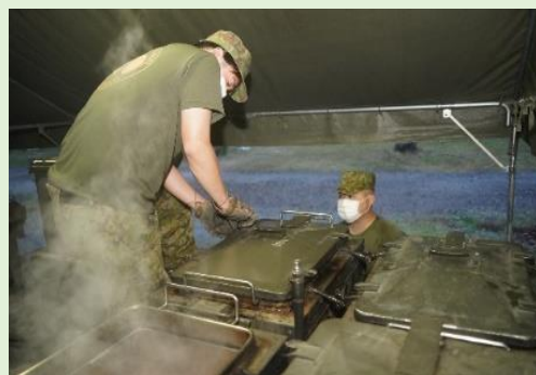
早朝から食事を準備する連隊炊事班