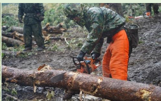
大雨中の玉切り作業