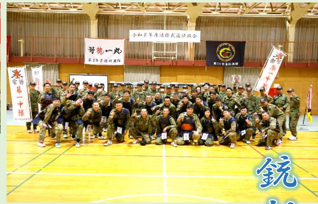
優勝した第1中隊 (銃剣道の部)