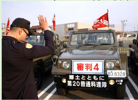
確実な安全点検を実施