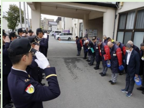
競技役員との対面式