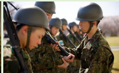
基本教練（執銃停止間の動作）