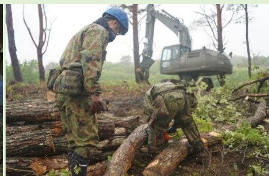
安全係による適確な安全指導