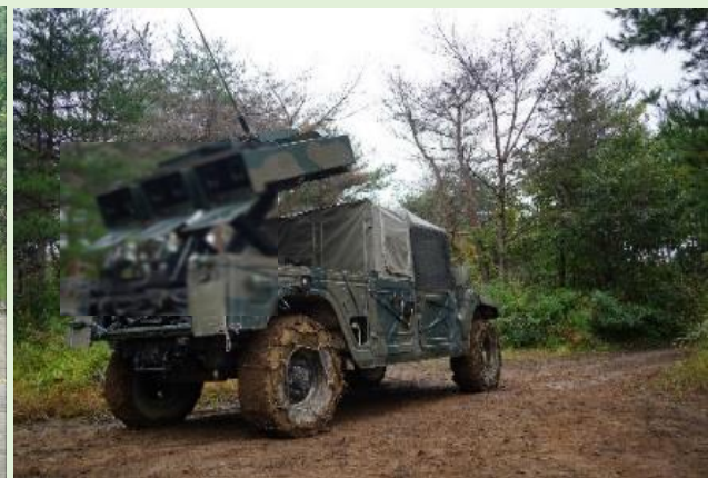
迅速に射撃をする対戦車小隊