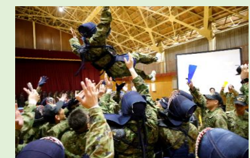
第1中隊長の胸上げ (銃剣道)