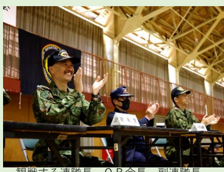
観戦する連隊長 O B 会長 副連隊長