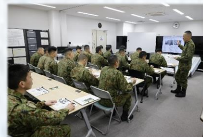
講話に参加し、理解を深める隊員