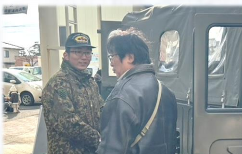
来場者と会話を楽しむ隊員

イベント当日は郷土料理である寒鱈汁を目当てに県内外から約2万人が訪れ会場は賑わいを見せた。自衛隊ブースでは支援した隊員たちが記念撮影の依頼に快く応じたり、寄せられた質問に対し澁刺と受け答えを行うなど、来場者との交流により、自衛隊の活動に対する理解の促進と魅力の発信を図ることができた。