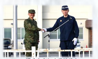
握手を交わす両統裁官