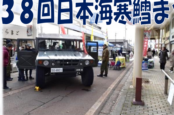
自衛隊ブースの様子

1月18日(日)、鶴岡銀座通りで実施された「第38回日本海寒鱈まつり」に自衛隊山形地方協力本部が実施する広報展に重迫撃砲中隊(中隊長 山端1尉以下3名)が車両展示(高機動車)により支援した。