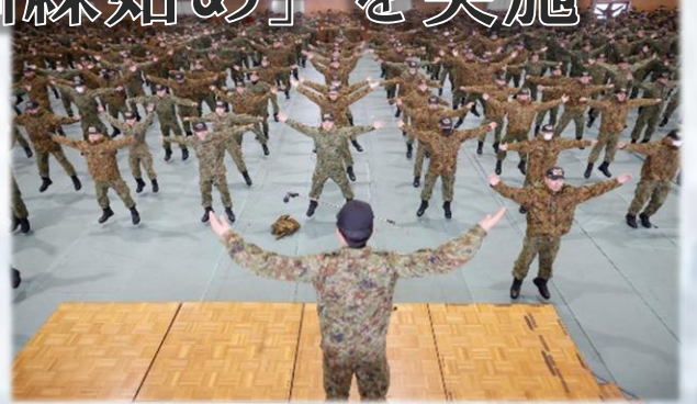
新年最初の自衛隊体操を実施