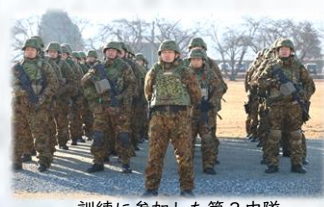
訓練に参加した第2中隊