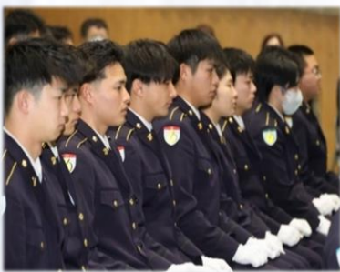
厳正な表情で式に臨む隊員