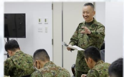
講話を実施する連隊長

1月20日(火)、B庁舎において連隊長によるWPS(別表で説明)講話が実施され、参加した隊員は自衛隊としてのWPSに対する今後の取り組み方について理解を深めた。