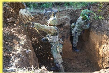
防御陣地の構築 (第2中隊)