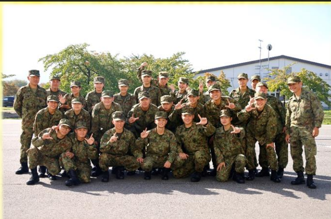
後期教育隊全員で記念撮影