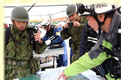
レスキュー隊との情報共有 (村山市総合防災訓練)