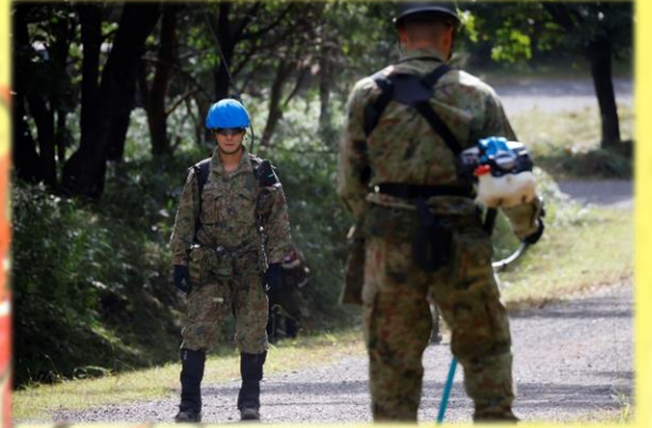
安全第一に！目を光らせる安全係