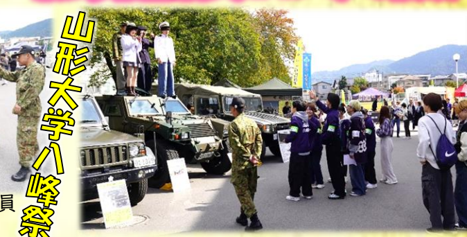
山形大学ハルマ祭