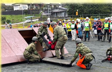
倒壊家屋からの救助訓練 (村山市総合防災訓練)