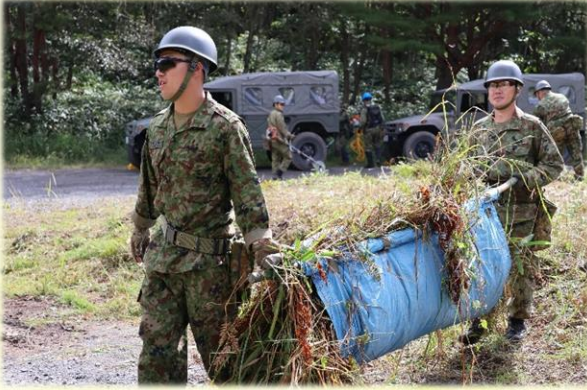
永遠と続く草運び