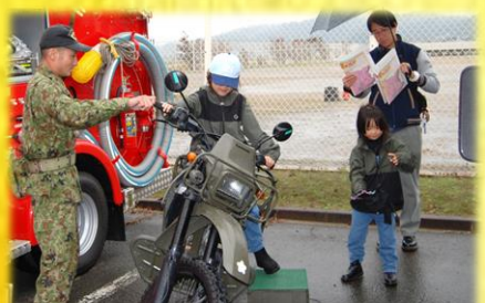
オートバイの説明をする隊員 (河北町総合防災訓練)

10月14日(火)から18日(土)までの間、王城寺原演習場(宮城県)において令和7年度第4次連隊野営を実施し、第2中隊は訓練検閲(防御)を受閲、連隊本部・各中隊は徒步行進訓練(60km)を通じ、徒步行進能力の練度向上を図った。訓練間、寒暖差が激しく悪天候にも見舞われる厳しい環境下であったが、部隊の基本的行動(敵を意識した戦闘行動、指揮の継承)及び新領域(ドローン・電磁波・衛星)への対応を含む基本基礎動作の練度を向上させ、隊員一人一人が全力を尽くしそれぞれの任務を完遂した。