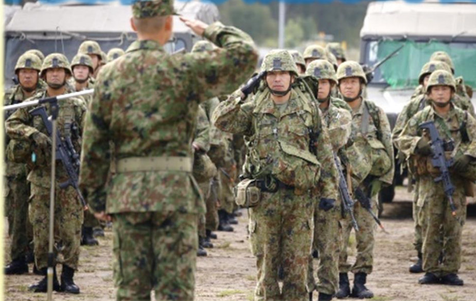
統裁官 (連隊長に対する受閲準備完了報告)