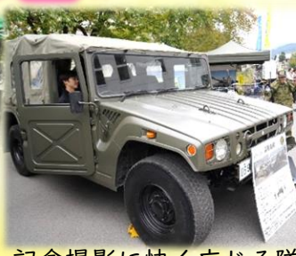
記念撮影に快く応じる隊員