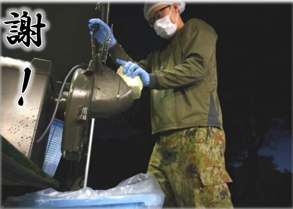
早朝の炊事（午前3時）

連隊の皆さん、秋季統一整備大変お疲れさまでした。私も作業の前、中、後に食べる温食はいつも楽しみにしています。今回は炊事班としてご飯を作る側でしたが整備隊の皆さんのお氣持がわかりますので心を込めて調理することができました。炊事班は朝3時頃から作り始めますが、眠さにも負けず、調理に全力を尽くしている連隊炊事班がいることを忘れないでください。お味はいかがでしたか？