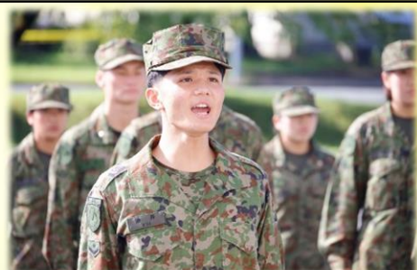
申告 油井 1 士