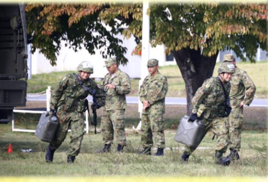
体力検定2型(重量物運搬)

10月8日(水)から10月10日(金)までの間、「第149期陸曹候補生選抜2次試験」が実施され、筆記試験に合格した20名の隊員が受験した。 8日、9日に口述試験及び今回より戦闘教練が術科試験に採用され、試験が行われた。10日には体力検定(3000m走)及び腕立て伏せ・腹筋)及び戦術等に直結する体力検定(重量物の卸す運搬)及び積載・短距離疾走・超壕)の計6種目が実施された。 受験者たちは日々の練習の成果を十分に発揮し、「陸曹候補生の指定」を目標とし、全力で試験に取り組んでいた。