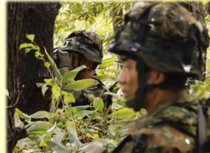
敵情を警戒する隊員 (第2中隊)