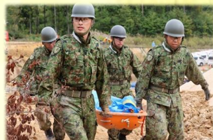
レスキュー隊との情報共有 (北海道東北ブロック合同訓練)