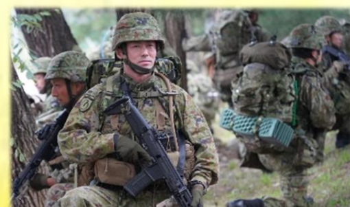
行進前の四周警戒 (本部管理中隊)

10月14日(火)から18日(土)までの間、王城寺原演習場(宮城県)において令和7年度第4次連隊野営を実施し、第2中隊は訓練検閲(防御)を受閲、連隊本部・各中隊は徒步行進訓練(60km)を通じ、徒步行進能力の練度向上を図った。訓練間、寒暖差が激しく悪天候にも見舞われる厳しい環境下であったが、部隊の基本的行動(敵を意識した戦闘行動、指揮の継承)及び新領域(ドローン・電磁波・衛星)への対応を含む基本基礎動作の練度を向上させ、隊員一人一人が全力を尽くしそれぞれの任務を完遂した。