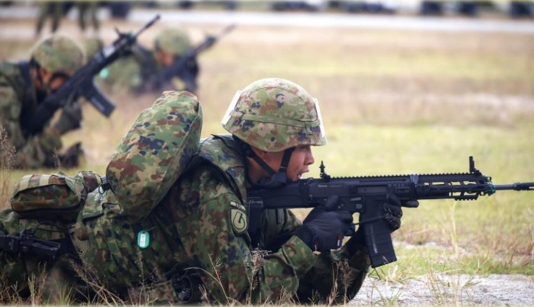
術科試験(戦闘教練)