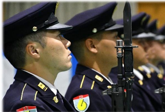
厳正な儀じょうを実施