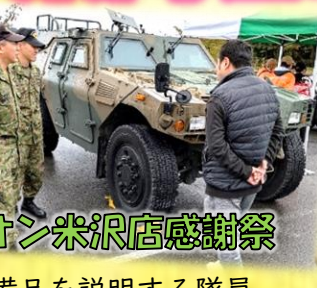
装備品を説明する隊員