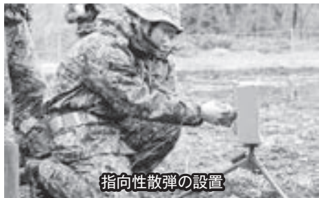
指向性散弾の設置