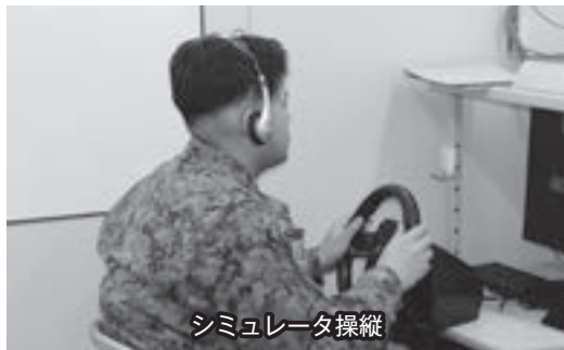
シミュレータ操縦