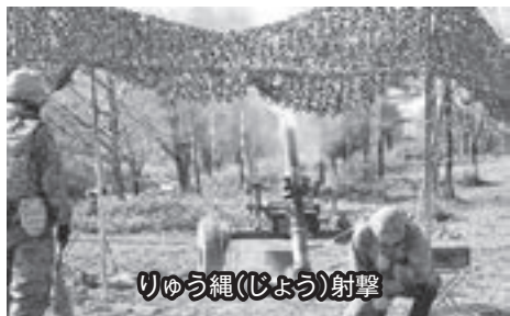
りゅう縄(じょう)射撃