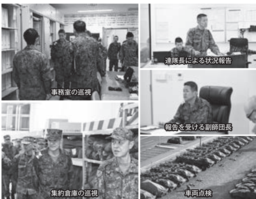
連隊長による状況報告

これらの結果を通じ、各業務における管理体制の適正な運用が確認されるとともに、改善事項及び留意点が明確となり、連隊としての統制力及び実務能力の一層の向上につながる成果を得た。今後も、本検査の結果をふまえ、より適正で効率的な業務遂行に努めていく。