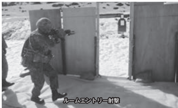
ルームエントリー射撃