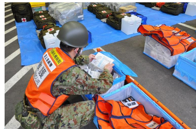
資材点検をする救護班員