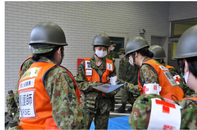
準備状況を確認する救護員