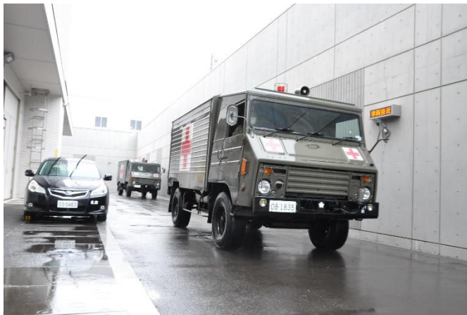
北部方面衛生隊(Amb)到着