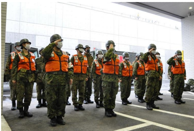
派遣準備完了報告