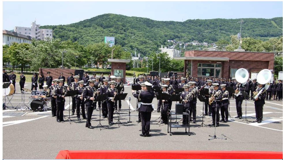
音楽演奏（北部方面音楽隊）