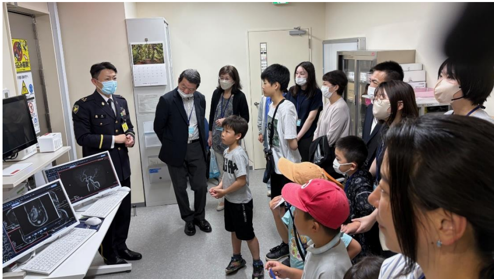
家族向け施設見学