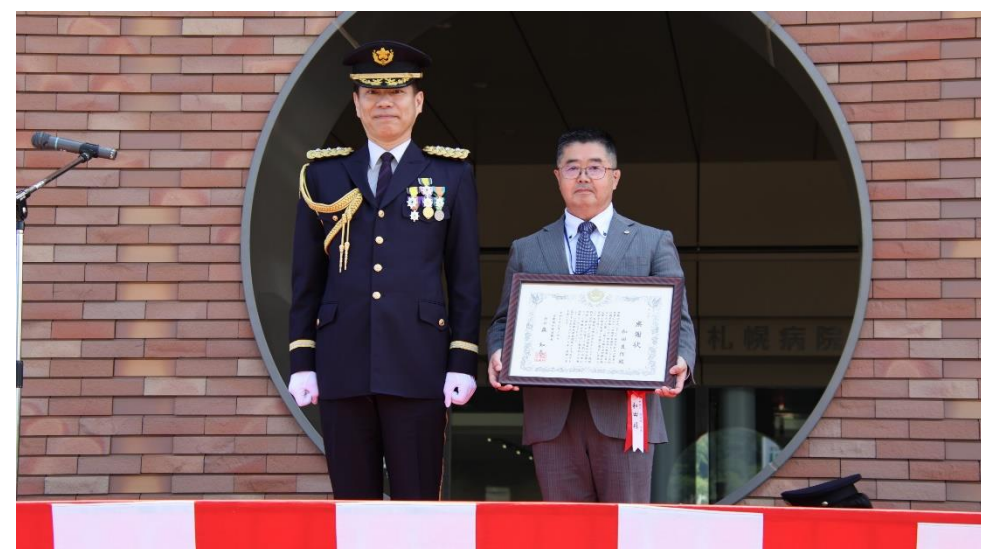
感謝状贈呈（札幌地方隊友会長）