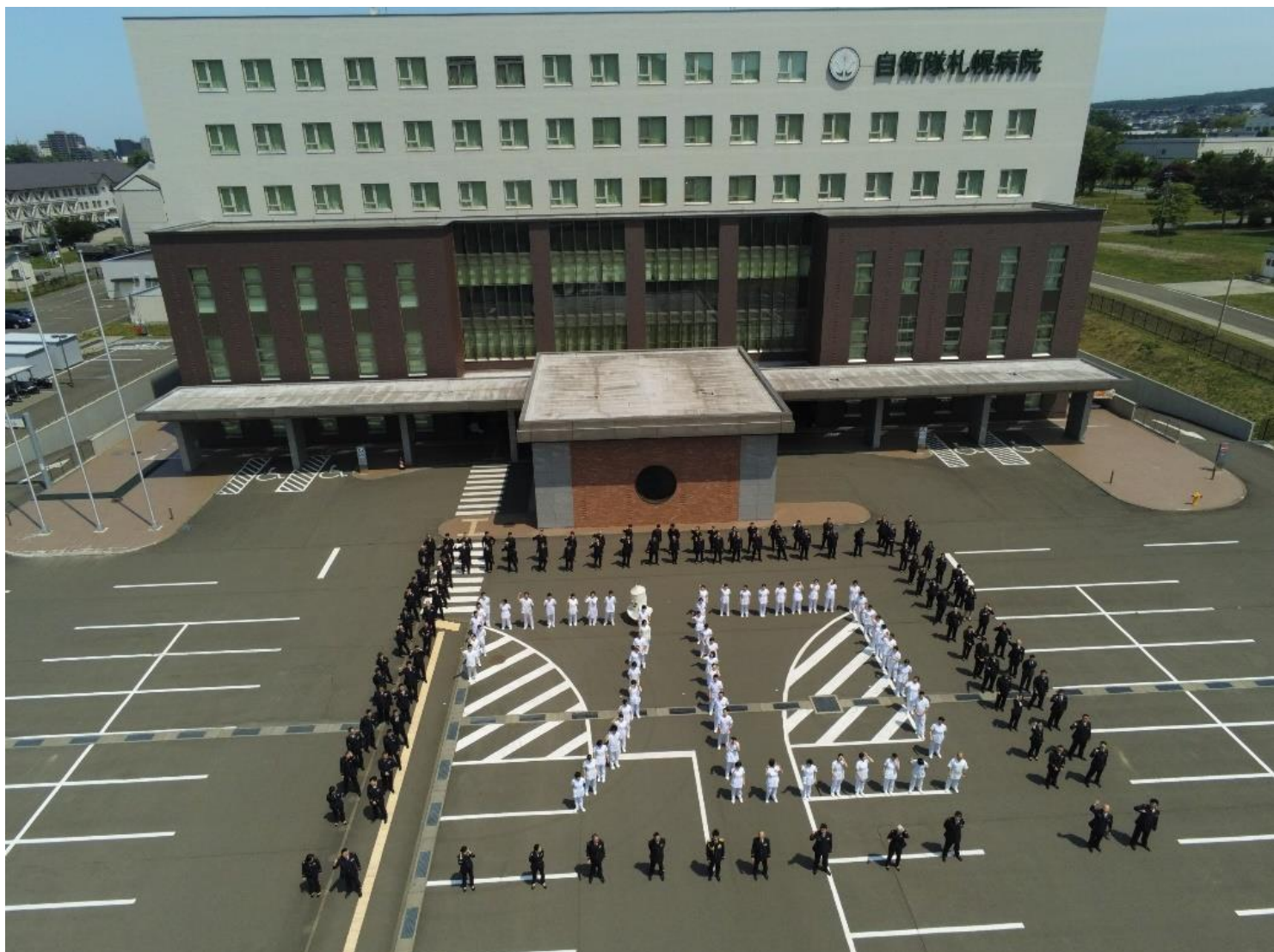
創立70周年記念人文字