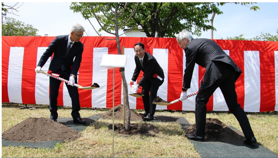
記念植樹（歴代病院長）