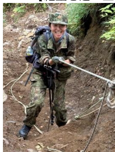
【険路を笑顔で綱登り】