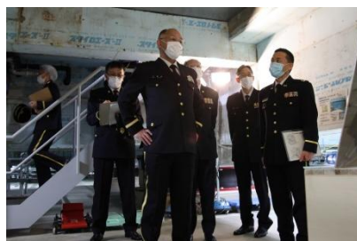
初度巡視 (免震構造)