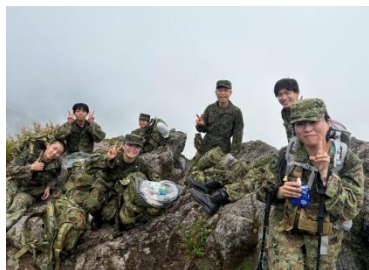
【絶景?を眺め、ひと休み☆】