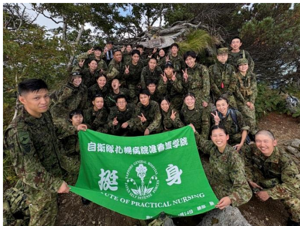
【50期生と教官みんな笑顔で踏破!!】