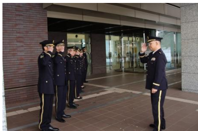
病院長初登庁 (出迎え)

自衛隊札幌病院は、今後、菊池病院長が掲げる統率方針の下、全職員が一丸となって職務に精励し、自衛隊衛生の一翼を担う組織として、如何なる任務に対しても確実に応え得る態勢の確立に万全を期するとともに、隊員及び国民にとって「心の通う信頼される病院」としてさらなる発展を遂げて行くことを胸に誓った。