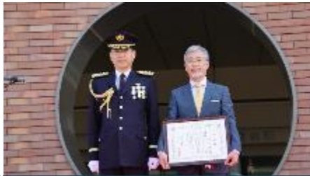
感謝状贈呈（豊友会長）