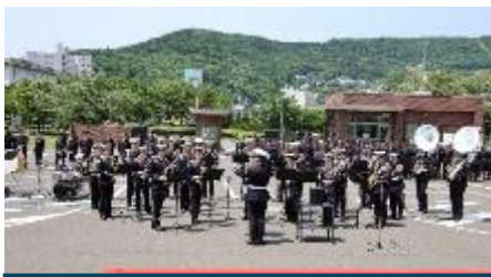
音楽演奏（北部方面音楽隊）