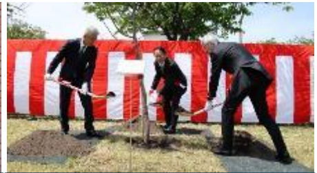
記念植樹（歴代病院長）