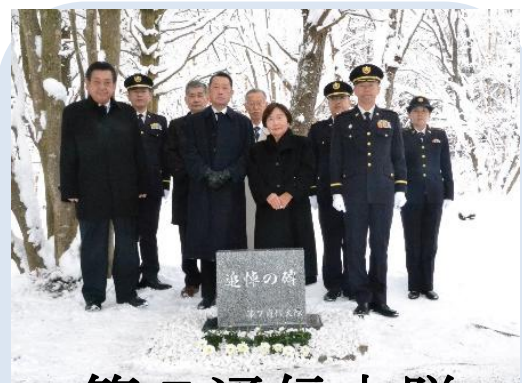
第7通信大隊 慰霊碑建立