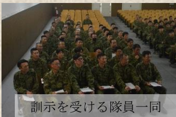
訓示を受ける隊員一同