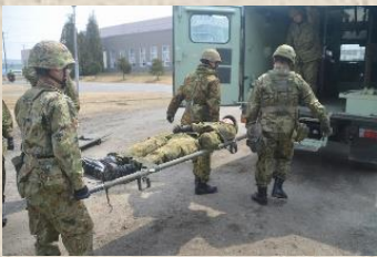
負傷者を担架搬送している様子