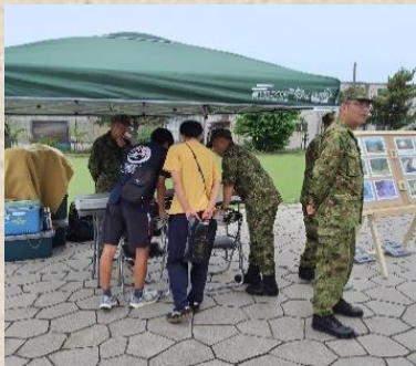
興味を示された方々に丁寧に対応