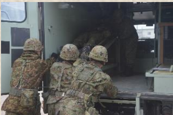
担架搬送した負傷者をアンビに積載中