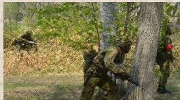
前進指揮する隊員