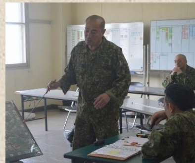
偵察目標へ前進中の二小隊戦車