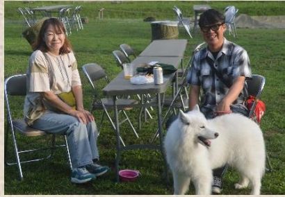
付配置の末吉曹長もご家族で参加