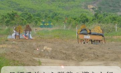
目標手前から弾着の導きを行っている