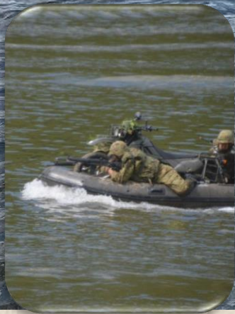
夜間の行動を明るい内に確認