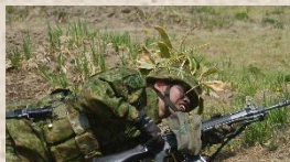
身を隠しつつ前進