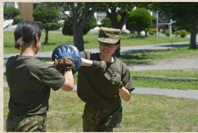
基礎訓練実施中の女性隊員

隊は、格闘指導官特技保有者による練成計画により、年度を通じて格闘練成訓練を実施している。格闘訓練については近年の諸外国においての近接戦闘で生じた教訓等に基づき練成内容が目まぐるしく変化しており、起こりえる様々な状況に対する対処要領を演練している。訓練は基礎的な技術を段階的に演練したのち、一連の状況下において個人対応から班分隊規模での対処要領を練成している。隊は、近接戦闘における様々な状況に対応できるように引き続き演練し近接戦闘能力の向上を図る。