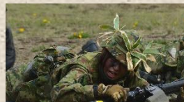
陣前までほふく前進

令和七年五月、第十一普通科連隊が担任実施する履修前教育に六名の隊員が参加した。学生達は同期と共に汗を流し、熱心に教育に臨んでいた。また、今期には7偵に女性自衛官が配置されて初めての女性陸曹候補生が教育に参加している。今後の後輩陸士の手本となる陸曹になるよう期待をする。