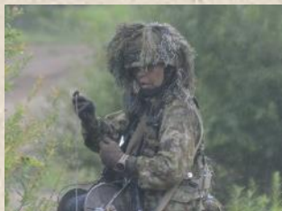
じ後を見越して迅速に行動する河内二曹