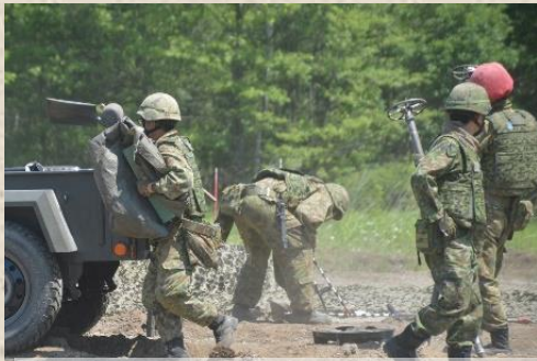
砲器材を撤収し、陣地変換する分隊