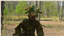
身を低くして前進