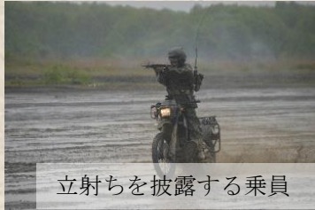
立射ちを披露する乗員