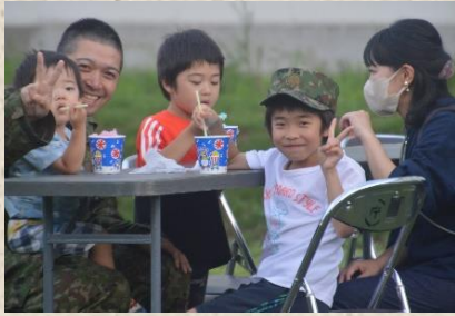
子供たちはかき氷大好き