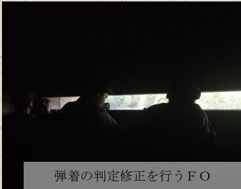
弾着の判定修正を行うFO