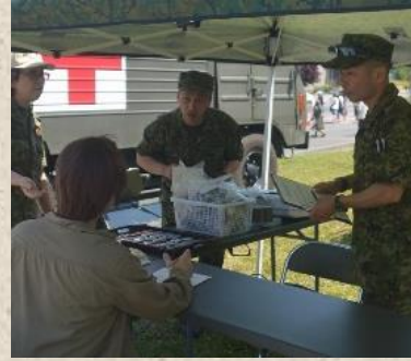
自衛隊の魅力伝える先任と総務幹部