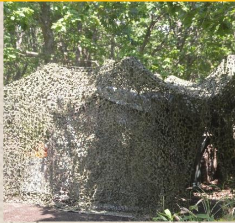
第七偵察隊指揮所