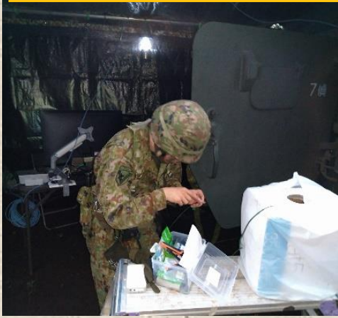
システム構成実施中の隊員