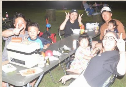
今年も家族総出でのご参加ありがとうございます。

「令和七年度東千歳駐屯地夏祭り」総務による炭火焼き鳥は終始大盛況 隊は令和七年八月五日、東千歳駐屯地で実施された令和七年度東千歳駐屯地夏祭りに参加した。今年度は隊員と隊員家族が祭りを楽しめるよう催し物は各部隊計画で実施をして、駐屯地多目的広場では機甲太鼓及びキッチンカー等の出店により祭りを盛り上がり、隊においては総務による炭火焼き鳥を提供し、特に小さいお子様には水ヨーヨー釣りやかき氷を提供する等、終始催し物は大盛況だった。また、祭り終盤には恒例の打ち上げ花火が打ち上げられ、お祭り参加者は歓喜の声を上げていた。