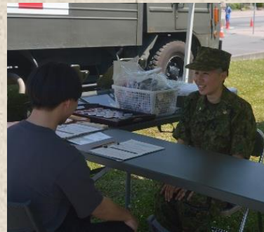
営内生活について説明する女性隊員