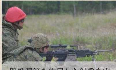
照準眼鏡を使用した射撃を実施