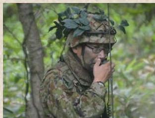
確実に動作確認をして万全を期す都築准尉