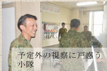
予定外の視察に戸惑う小隊