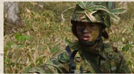
7 偵初の女性候補生