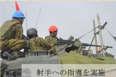
射手への指導を実施

隊は令和七年六月十七日、島松地区第二戦車射場においてHMG射撃訓練を実施した。 本射撃訓練は各分隊の若年隊員を対象にHMG射撃における訓練準備から、基本的な射撃要領等の修得を目的として実施したが、事前の空包射撃訓練の介あつて淡々と射撃訓練は進み、各分隊の射撃練度の向上に繋がる射撃訓練となった。 引き続き基盤を確保しつつ継続的な練成射撃訓練を実施して隊の練度向上を図る。