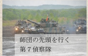
師団の先頭を行く第七偵察隊