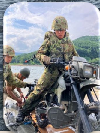
オートバイを積載する分隊員

隊は、令和七年七月二十二日から二十四日の間、第十一偵察隊が担任実施する偵察部隊合同訓練に参加した。今年度については小銃分隊員の若年隊員を主体に訓練に参加した。 当初、訓練準備として偵察用ボートの組み上げ及び運搬要領を演練したのち、オートバイの積載要領を演練した。じ後は夜間潜入実施のため段階的に訓練を進めて夜間潜入の準備を完成させた。 水路潜入は全ての偵察隊員において必須のため、隊としても練成訓練を計画し練度の底上げを図る。