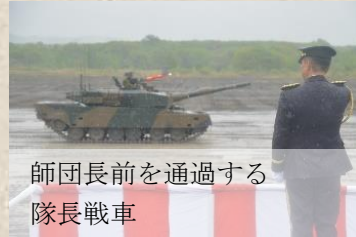
師団長前を通過する隊長戦車