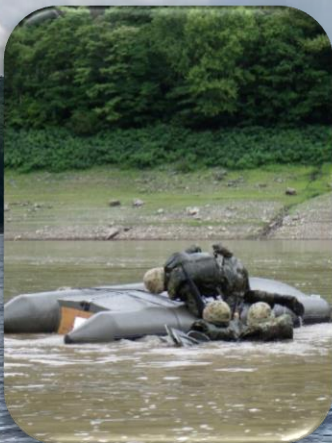
転覆からの復旧訓練の様子