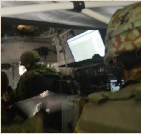
CCV内でも情報を共有