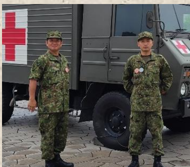
小隊からも支援を受けて広報活動を実施