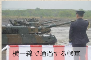
横一線で通過する戦車