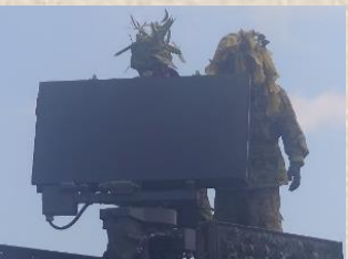
放射機の方角角を設定する隊員