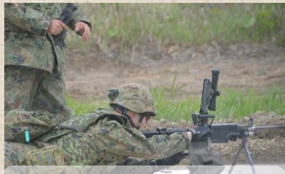
射撃準備の様子 確実な薬室点検の実施