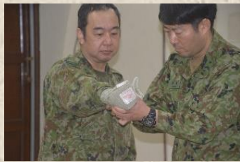
負傷部位への処置要領を展示する衛生班