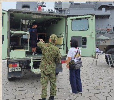
展示車両について説明する隊員