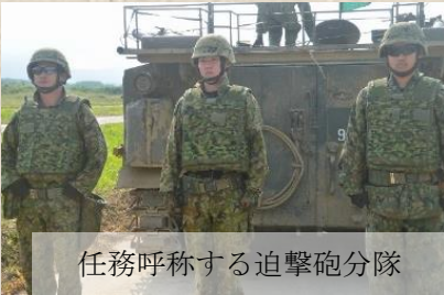
任務呼称する迫撃砲分隊