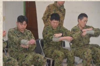
示された負傷部位を救急包帯で処置