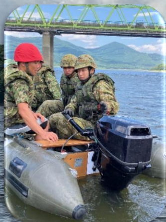
偵察用ボートの体験操縦