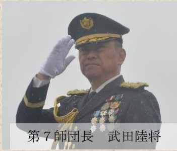
第7師団長 武田陸将

五月二十五日、第七師団創隊七十周年東千歳駐屯地創立七十一周年記念行事に参加をした。今年度は雨天のため記念行事は中止されたが、その間陰気な雰囲気も吹き飛ばすか、進めようという観望を誇り師団の威容を駆けし、また観覧進行も、訓練展示で、乗員が悪路も、斥候小隊の立派な水たまりをすらすらと走り抜ける姿に、威厳を披露した。