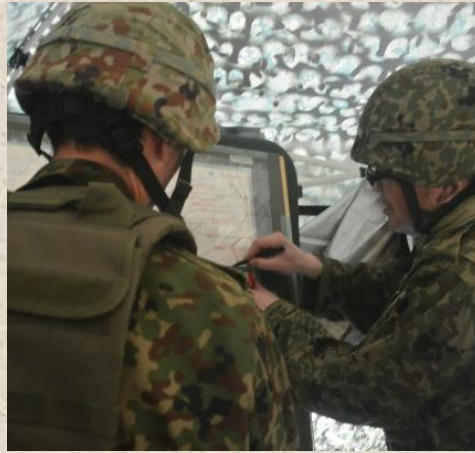
敵情を転記する隊員

隊は、令和七年七月二十日から二十二日の間、第一次師団訓練検閲に参加をした。 本訓練では隊本部機能を立ち上げ、主として隊の指揮幕僚活動の練度向上を図るとともに、実動部隊としては情報収集のため斥候小隊に直轄斥候組を配属し訓練に臨んだ。 日中気温三十度を超える暑さの中、目まぐるしく変化する戦況に各所掌において状況判断をし、熱中症対策を講じつつ任務を遂行することが出来た。 本訓練参加にあたり、問題点や改善を要する事項等を直ちに修正し、引き続き隊本部としての練度向上を図る。