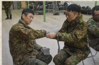
負傷者に対して応急救護を実施する隊員