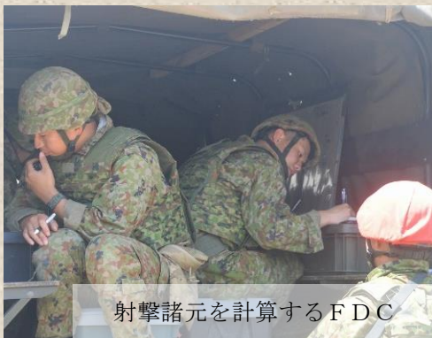
射撃諸元を計算するFDC

隊は令和七年七月一日然別演習場において、八十一ミリ迫撃砲射撃訓練を実施した。集成迫撃砲小隊として射撃分隊、F O、FDCの三者連携による正確かつ迅速な射撃練度の向上を図り、隊の戦闘射撃において戦車や小銃分隊を前線に推進させる際の火力発揮ができるよ