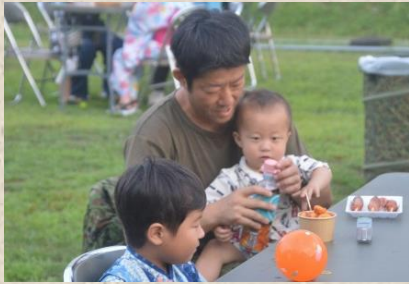
水分補給には麦茶が一番