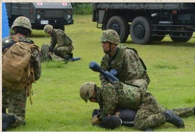
不審者を拘束中の隊員