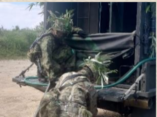
少人員での開設のため連携は必要不可欠