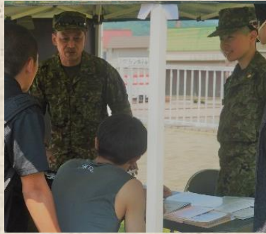
猛烈アピールで興味を誘う総務幹部