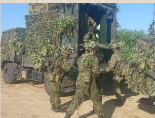
レーダ哨を迅速に開設するレーダ班