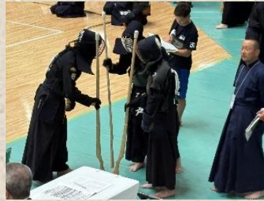
コートに整列する 七偵剣士