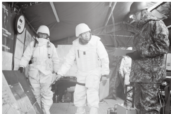
師団長への状況報告