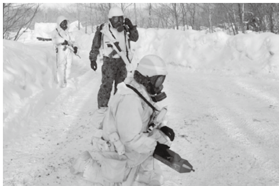
化学攻撃対処の様子

令和6年2月29日から3月3日までの間、第2次師団訓練検閲の場で大隊検閲が実施された。 検閲間は昼夜での激しい寒暖差や降雪・強風等厳しい気候条件であったが、年度を通じて実施してきた訓練成果を遺憾なく発揮し、大隊長の指揮の下一丸となり任務を完遂した。