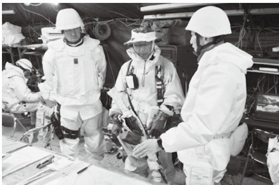
偵察班への障害偵察命令下達