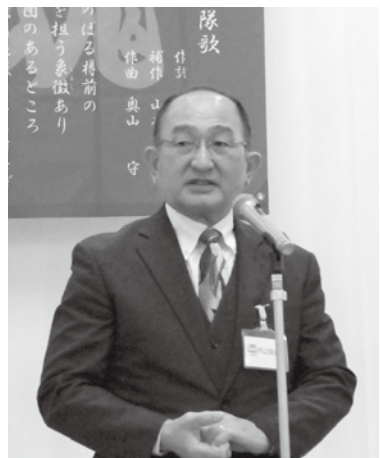
くろがね会会長ご挨拶