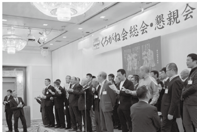
恒例の大隊歌斉唱

◆お願い…くろがね11号（H30年4月）でお知らせしていますが、5日以内での部隊の連絡で遺族からの申し出により死亡叙勲の手続きが進みますのでご家族のご理解をお願いします。