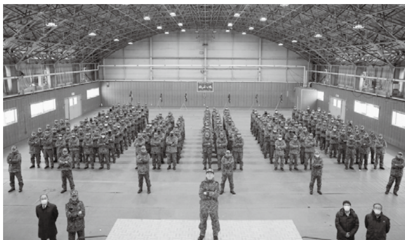
出陣式での集合写真

令和6年2月29日から3月3日までの間、第2次師団訓練検閲の場で大隊検閲が実施された。 検閲間は昼夜での激しい寒暖差や降雪・強風等厳しい気候条件であったが、年度を通じて実施してきた訓練成果を遺憾なく発揮し、大隊長の指揮の下一丸となり任務を完遂した。