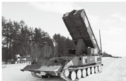
投射直前の地雷原処理車