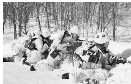
前方警戒中の分隊