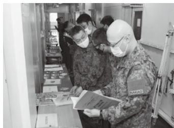
昔を懐かしむ最先任上級曹長

大隊は、令和3年1月12日、創隊60周年記念で埋設したタイムカプセルを発掘しました。当日は、新型コロナウイルス感染防止対策として、大々的には実施しなかったが、後日、内容品を展示し、昔を懐かしみ、大隊の歴史を振り返ることができました。