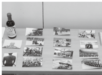
ワインも熟成されました