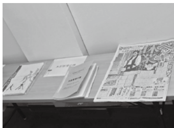
バッキーも色々ありました