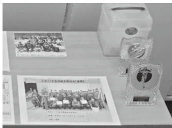
27年度持続走優勝の4中隊