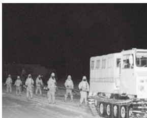
夜間の曳行スキー行進