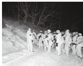
夜間の偽装効果の検証