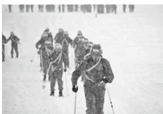
吹雪の中スタートした事前走