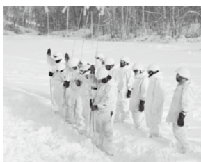
雪崩遭難者の プローブでの搜索