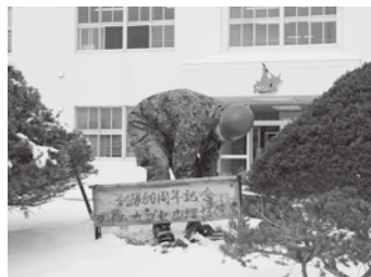
タイムカプセルを掘り起こす 1係佐藤 2曹