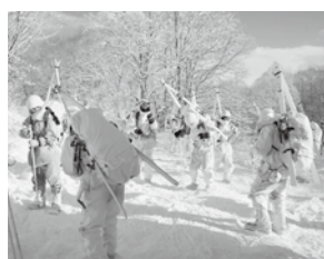
かんじきでの行進