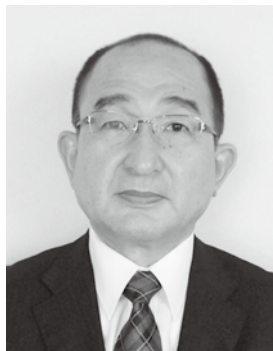
新くろがね会会長