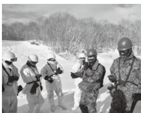
雪崩トランシーバでの 搜索要領

令和2年度 大隊冬季集中訓練 大隊は、令和3年1月18日から22日までの間、北大演(東千歳地区)において、令和2年度大隊冬季集中訓練を実施した。 大隊計画訓練として、スキー行進、偽装、遭難者発生時における行動及び応急ソリ作成を実施した。 スキー行進では、昼間及び夜間の曳行スキーを実施し、スキー行進における練度向上を図ることが出来た。又、偽装においては冬季における夜間暗視装置の効果を確認し偽装における認識を深めることが出来た。本訓練を通じ、冬季における戦闘の基礎を確立することが出来た。