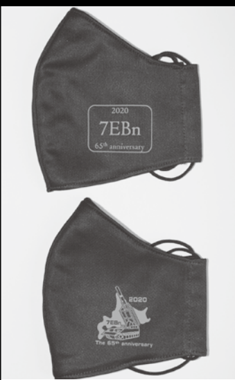
新型コロナウイルス感染予防として記念品は、マスクを2種類作成しました。