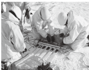
3型スキーを利用した 応急ソリの作成