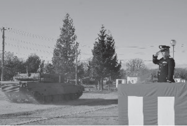
第一戦車中隊長着任式(観閲行進R5.12.4)

中隊は、冬季訓練検閲に向けて、 各個及び部隊訓練に励んでいると ころです。一人一人が担う役割に 対して、考えて行動し、中隊の任 務完遂へ向けて精進していきます。