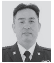
第七十三戦車連隊 第五代 最前任上級曹長

令和六年が隊員皆様そしてご家族皆様にとって明るく希望に満ちた幸多き一年でありますことをご祈念致し申し上げます。新年のご挨拶とさせていただきます。