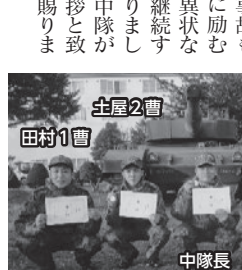
令和5年度連隊持続走競技会年代別優秀者達

今年度の干支の辰には、困難を乗り越え飛躍 する年という意味も含まれることから、「龍」 のつく言葉で「登龍門」は、黄河上流の急流 の渓谷、竜門をのぼりきつたさかなが竜に変 わったという伝説から成功への一歩となる難 関という意味があります。 昨年は、未曾有の大災害など困難の多い年 でしたが、今年はこの辰年にあやかっ、難 関を突破し、飛躍する年にしていきます。 それぞれの職務や場面において「らしさ」 を追求し努力を惜みず仲間同士お互いに 助け合い任務達成に果敢に挑み安全な状 況を生起させる事無く、そして一件の事故も 無く日々の訓練を積み重ね練度向上に励む 我が中隊と重ね合わせて、隊員から「異状な し」の声が毎日聞こえる明るい中隊を継続す ることを年頭に誓い、本年が皆様にとりまし て良い年でありまるとともに第四戦車中隊が 飛躍の年になる事を誓い、新年の御挨拶と致 します。引き続き、御支援・御協力を賜りま すように、お願い申し上げます。