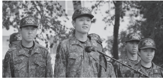
新配置隊員挨拶(連隊朝礼R5.10.3)

今年も新たな時代を築くた め、新しい種をまき、更な る進化ができる様、精進に励 みます。 本年が皆様にとって素晴ら しい一年になります様、御祈 念致します。