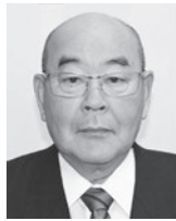
公益社団法人 千歳地方隊友会白老支部 支部長