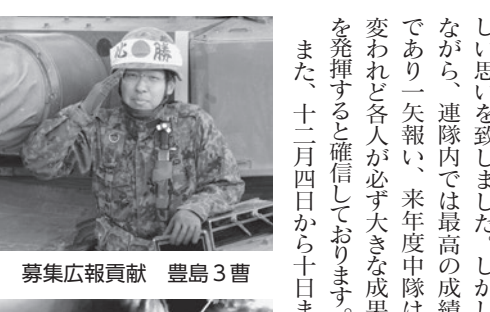
募集広報貢献 豊島3曹

第五戦車中隊は、十月六日に 実施された連隊戦車射撃競技会 において、練成の成果を最大限 発揮しましたが惜しくも三連覇 には至りませんでした。 この悔しさを胸に方面隊戦車 射撃競技会に挑み「優勝」を目標 に善戦しましたが願ひ叶わず悔 しい思いを致しました。しかし ながら、連隊内では最高の成績 であり一矢報い、来年度中隊は 変われど各人が必ず大きな成果 を発揮すると確信しております。 また、十二月四日から十日ま