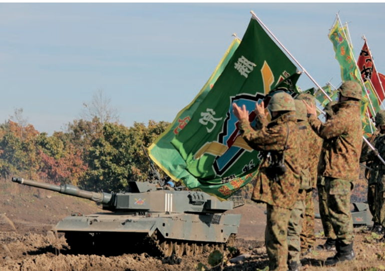
令和5年度方面隊戦車射撃競技会 (10月20～27日)