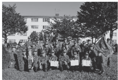
連隊戦車射撃競技会「優勝」