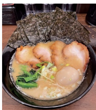
食べ応え満点です(100点)