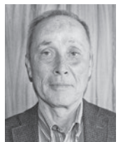
公益社団法人 道央自衛隊家族会 白老支部 支部長

隊員の皆様、そしてご家族の皆様には、令和六年が良き年となりますことを、ご祈念申し上げます。年頭のご挨拶とさせていただきます。