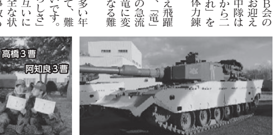
冬季訓練準備(冬季迷彩)