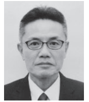
白老町自衛隊協力会 会長 白老町長