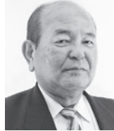
公益社団法人道央自衛隊家族会 会長 兼 自衛隊家族会苫小牧支部 支部長