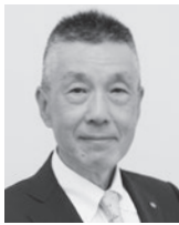
苫小牧自衛隊協力会連合会 会長 北海道自衛隊退職者雇用協議会 苫小牧支部 支部長

す。連隊も三月末には新体制になりますが、辰年の言葉のように活力旺盛で大きく成長できるように努力してまいります。引き続き皆様のご指導ご鞭撻を賜りますようお願い申し上げます。結びに皆様にとって幸多き一年でありますようにご祈念申し上げます。