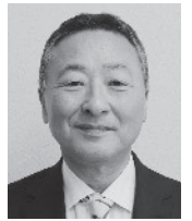
公益社団法人 千歳地方隊友会 苫小牧支部 支部長

苫小牧自衛隊家族会一同は、第七十三戦車連隊の皆様を応援していきます。第七十三戦車連隊の皆様と隊員ご家族の皆様益々のご健勝を祈念いたしまして年頭のご挨拶とさせていただきます。