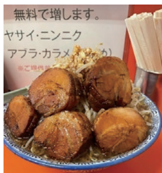
美味しい二郎系ラーメン