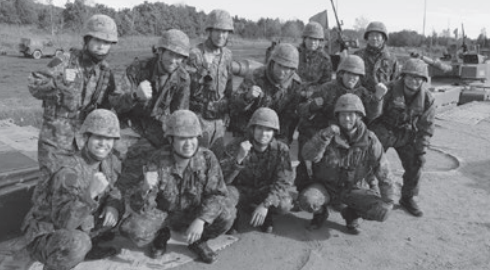
方面隊戦車射撃競技会 池田小隊(R5.10.24)