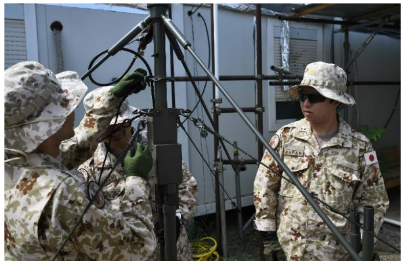
現場において指導・監督する通信2班長