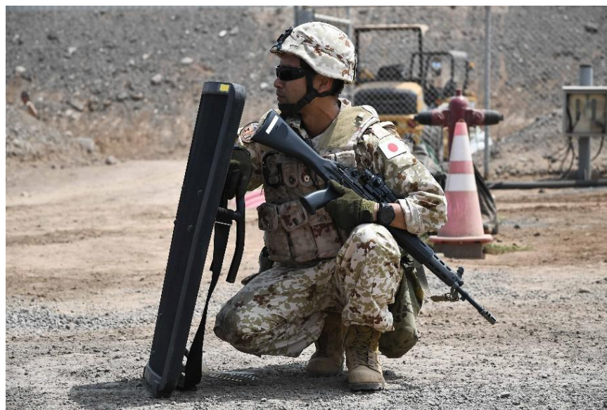
落下ドローンを発見しセーフゾーンの態勢を確保する警衛隊員