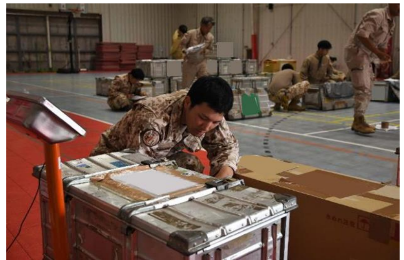
検量を行う輸送幹部