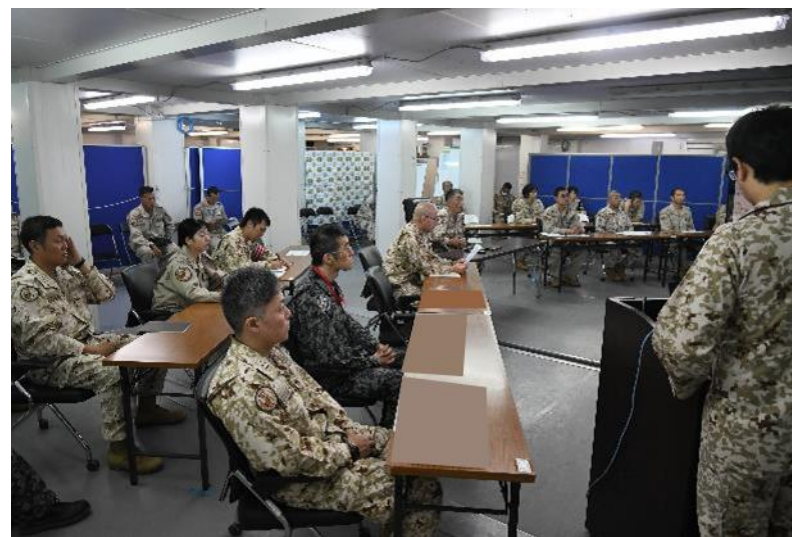
支司令及び主要幕僚等による机上演習