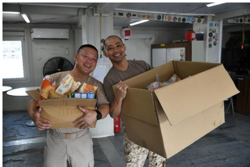
加給食を受領し喜ぶ人事幹部と文書海曹