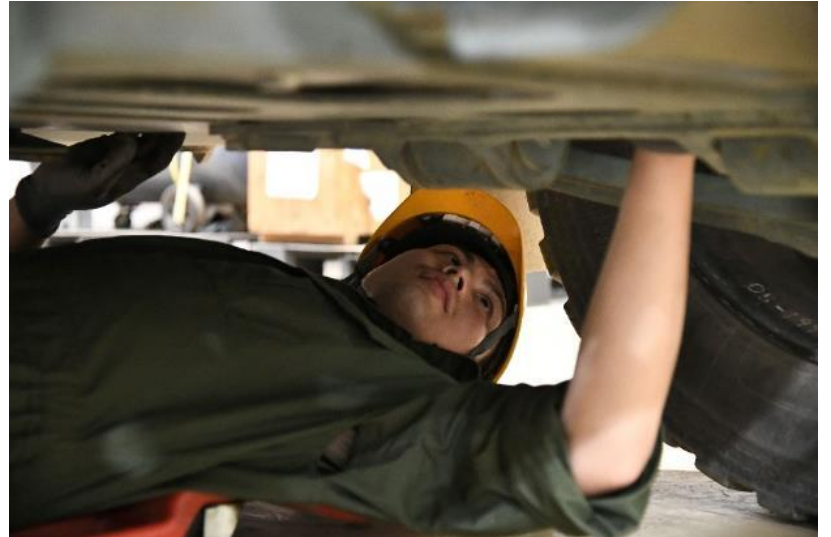
車両下部の細部まで点検する 装輪車整備陸曹