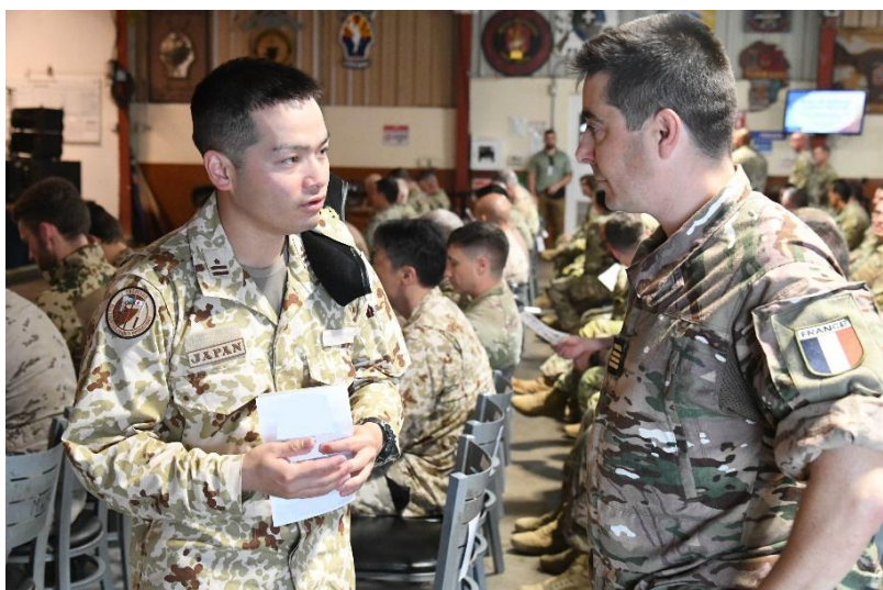
仏軍LOと懇談する警衛隊長