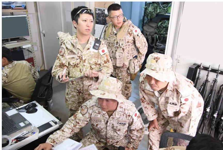
ドローンを発見し速やかに対応行動をとる警衛隊員