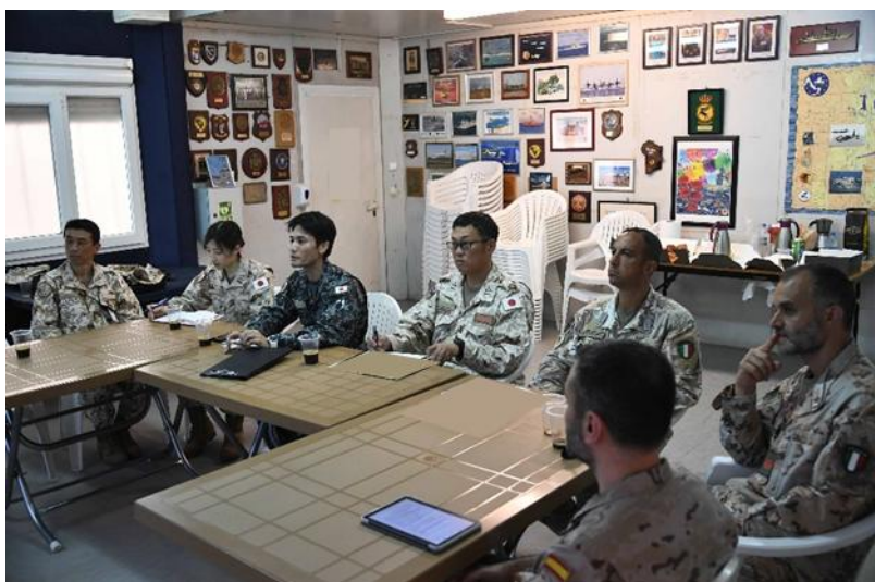
BA188(仏軍基地)の西軍地区において日伊西のCIMIC担当者により今後の活動内容を共有・調整