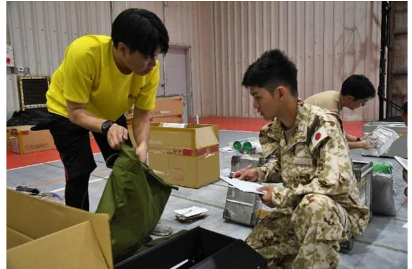
帰国する隊員のコンテナ検数を行う 補給整備班員