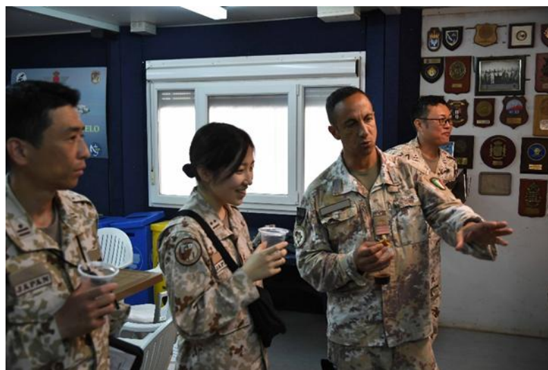
伊軍担当者と親睦を深める厚生幹部