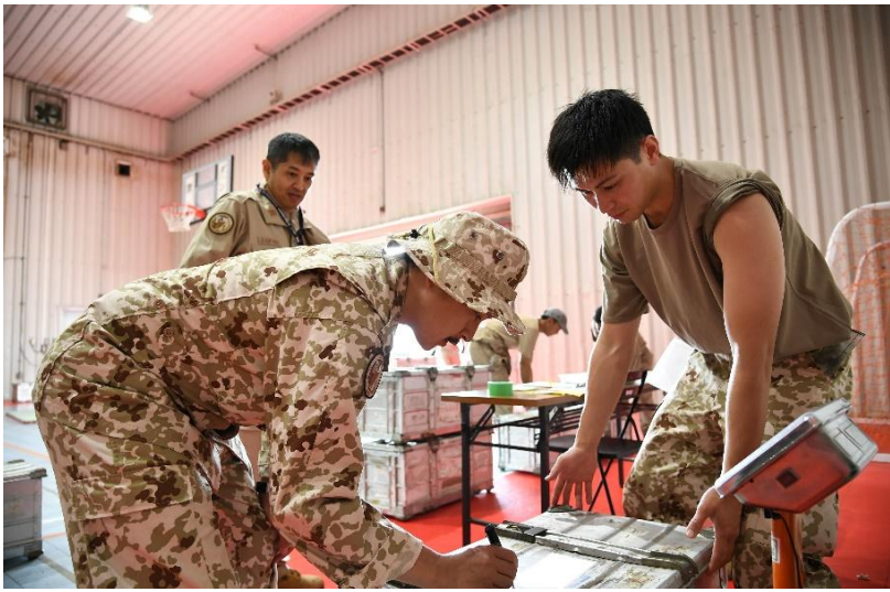
検量を行う補給整備2班員