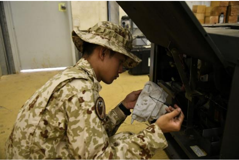
動力部の機能点検を実施する 発電機整備陸曹