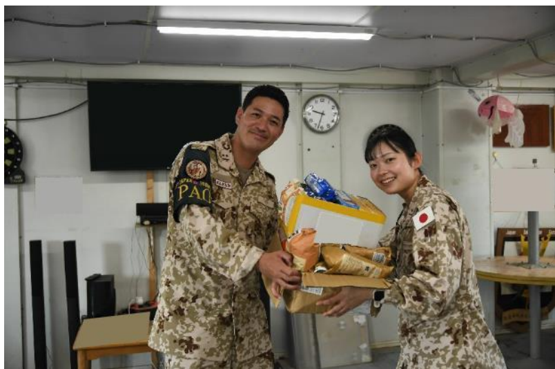
給養幹部から加給食を受領する広報幹部