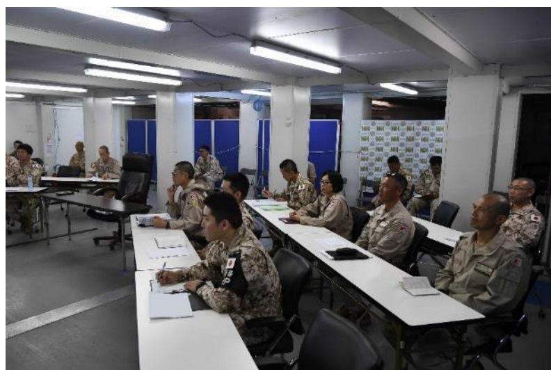
実行委員長である首席幕僚(企画)及び業務隊長(管理)を中心に要領の深化を図る各幕僚