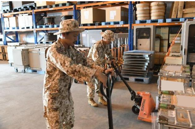
部隊交代するDAP E隊員のコンテナを運搬する 補給整備班員