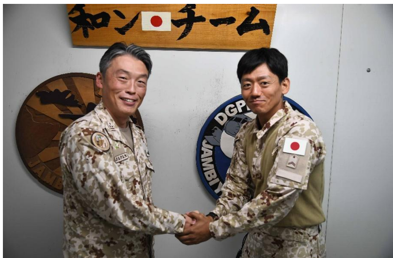
月間勤務優秀者と支司令による記念撮影