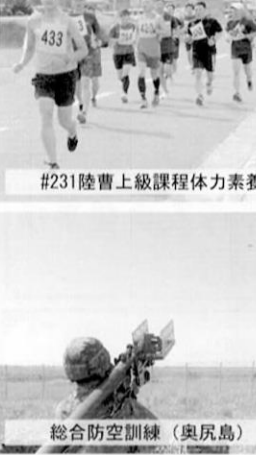
総合防空訓練(奥尻島)