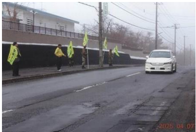
駐屯地部隊と通行車両に旗振りをしている隊友

岩見沢駐屯地正門前を走る道道岩見沢桂沢線沿いにおいて隊友9名は、駐屯地隊員とともに通過する車に交通安全を呼びかける黄色の「交通安全旗」の旗振りを実施して交通事故防止の呼びかけを行いました。本行事は防衛省交通安全運動計画に基づき岩見沢駐屯地が春・夏・秋・冬に実施している施策です。道道を通行するドライバーに対して安全啓発の旗振りを力強く行いました。