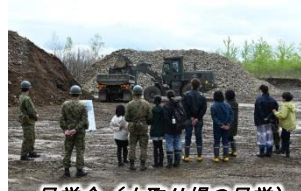
見学会（土取り場の見学）