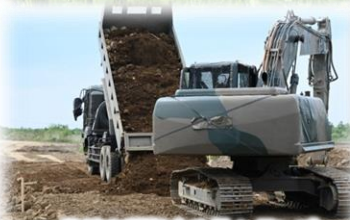
骨材を運搬する7tダンプ