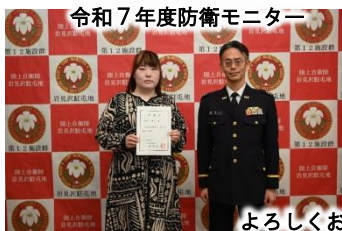
令和7年度防衛モニター