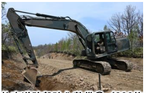
装軌車道路盤強化整備②（399施中）