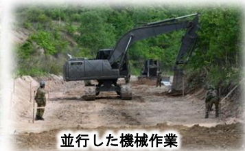
並行した機械作業