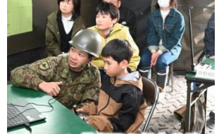
ドローン模擬飛行操作体験