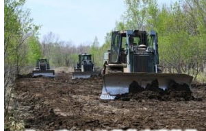
ドーザによる装軌車道整備