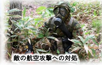
敵の航空攻撃への対処