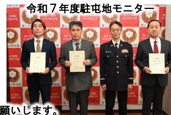
令和7年度駐屯地モニター