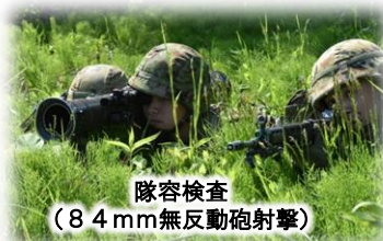
隊容検査 (84mm無反動砲射撃)