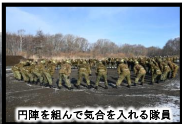
円陣を組んで気合を入れる隊員