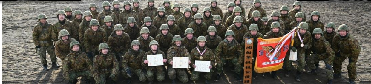
優勝後の集合写真