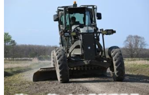
グレーダによる装軌道整備