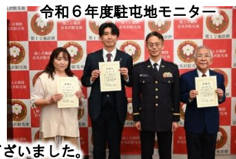
令和6年度駐屯地モニター