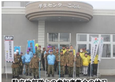
駐屯地部隊との参加者集合の様子

約30分間の短い時間ではありましたが、年齢58歳から75歳までの隊友は若い隊員に負けず、元気に旗を掲げためかせました。通行した車両約140台の中には目で挨拶を返すドライバーもおりました。本取り組みを通じて安全運転・事故防止意識の啓発に寄与するとともに、地域に対する隊友会組織の周知と隊友会と岩見沢駐屯地との絆を一層強固にすることができました。