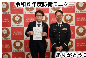
令和6年度防衛モニター ありがとうございました。

岩見沢駐屯地は、モニターの皆様から寄せられるご意見を真摯に受けとめ、地域の皆様からの理解と信頼を深めていただくとともに、綿密な連携を図っていく。