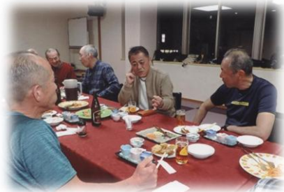
懇親会での会話に夢中の隊友