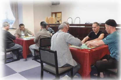
麻雀に熱心な隊友