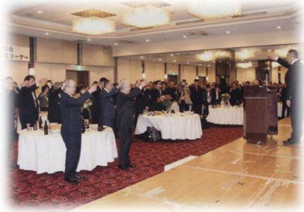
新年交礼会開会の様子

支部役員は、支部特別会員である市議会議員、文化団体などの方々と新春の挨拶を交わすとともに、広報紙のスポンサー企業の代表とも会話できる時間があり、本年の支部行事などの展望について語り合うことができました。