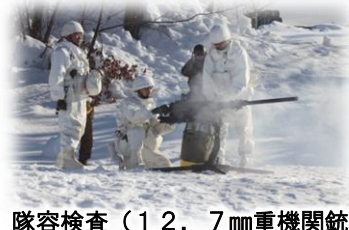
隊容検査（12.7mm重機関銃）