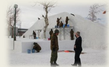
岩見沢市長・駐屯地司令訪問