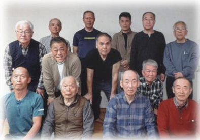
隊友の集い参加者集合写真

その後の2次会では6人が赴き、1次会で叶わなかったカラオケと近況内容を存分に発信して平素のストレスの解消と切磋琢磨に寄与することができました。