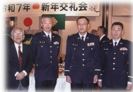
支部役員と業務隊長・司令・群1科長