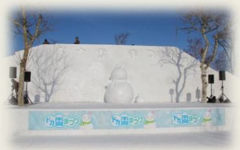
完成したメインステージ（開催日）