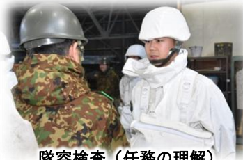
隊容検査（任務の理解）

検閲間は今シーズン最強寒波が押し寄せ、氷点下10度以下の厳しい寒さになる中、第400施設中隊は、一件の事故無く無事に駐屯地及び家族のもとに帰還し、任務を達成する事ができた。今後も諸職種協同における施設支援能力を向上すべく日々錬磨していく。