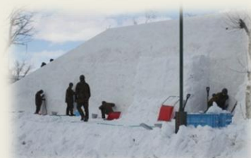
メインステージ製作中