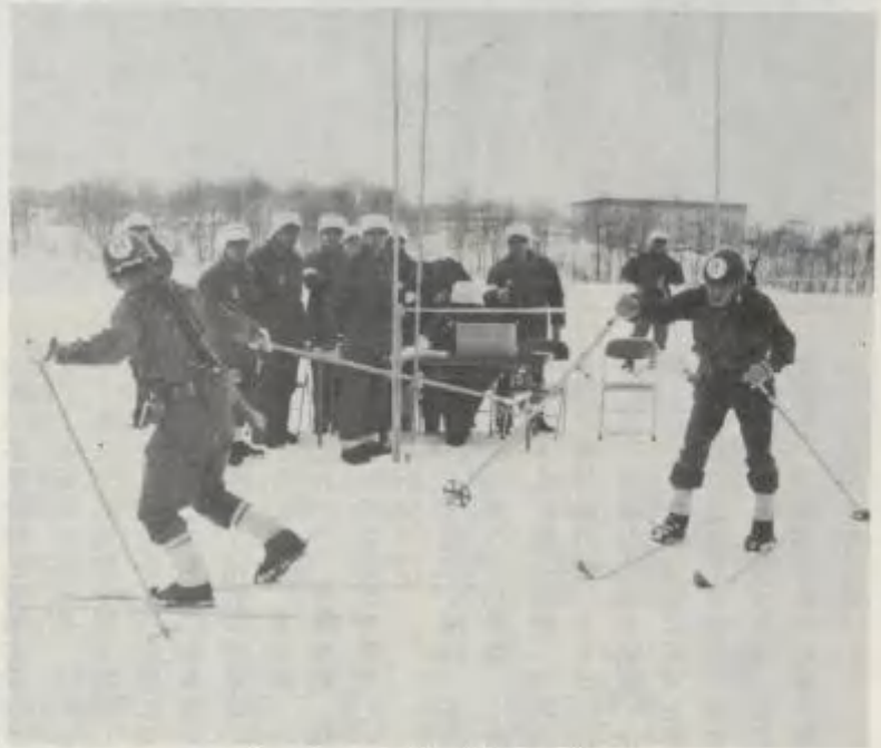
(マカセナサイ) (タノムゾ)

二月十五日、十二施設群冬季競技競技会(スキー)を駐屯地及び孫部演習場において実施。 一般走及び階級別リレーを行ない、熱戦の結果、三〇一地区地区施設隊が総合優勝を成し遂げた。 三〇一地区施設隊は、群主力と離隔した酷寒の地(名寄)において、ひたすら訓練に励み、持続走、銃剣道、スキーにと、群、団各種競技会においても常に上位を獲得しており、隊長以下の精進が此の日においても立派に実証された。