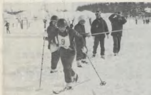
力走する婦人自衛官

競技種目は、分隊機動(六キロ)階級別リレー(三キロ)女子(三キロ)個人別(六キロ)を行ない、日頃、電卓トントン、算盤パチパチと駐屯地会計業務多忙な会計隊ではあるが、この日に備え、各隊とも充分訓練を積み重ね、勝敗の行方は階級別リレー終了まで予断を許さなくなり、熱戦の結果、結局地元の利を生かし、見事、岩見沢会計隊が逆転総合優勝に輝いた。