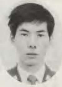
村上 3 曹

事前偵察の時は雪はなかったのに、進入時には約四十センチの積雪があり、様子は一変しておりま