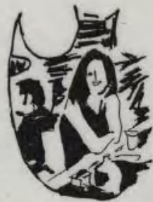
お酒の飲み過ぎに 氣をつけよう