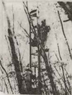
立木にはばまれ苦闘のロープウェイ構築(三〇一地区施設隊)

一〇月一五日、元西方総監、堀江正夫先生と元北方総監、倉重真先生の両先生を招き、駐とん地講堂において時局講話を実施した。特に自衛隊の現状認識と、世論及び国防の重要性についてそれぞれ講演され、果まつた約二〇〇名の隊員に深い感銘を与えた。