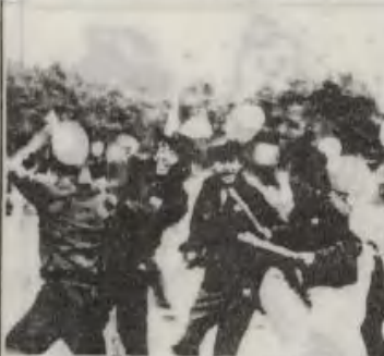
ワンパクまつり?秋の駐とん地運動会