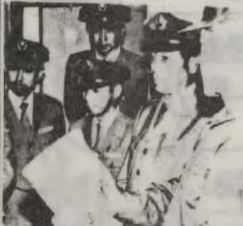
陶芸部の作品に見入られる田中象二北部方面総監