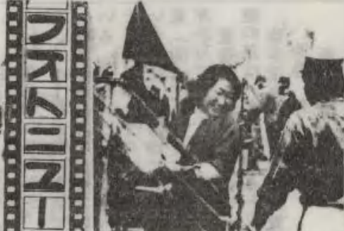
笑いイッパイ、賞品イッパイうれしさイッパイ。1等賞!