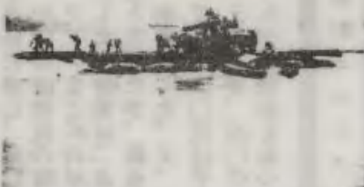
朝モヤをついて戦車部隊の強行渡河(337施中)