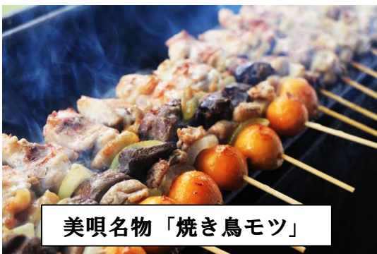
美唄名物「焼き鳥モツ」