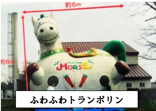
ふわふわトランポリン