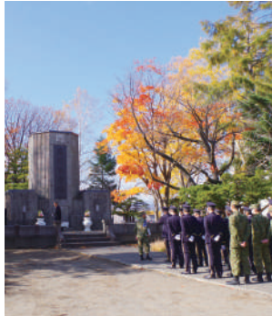
平和公園内にある月寒忠霊塔

11月4日(土)、連隊が所在する札幌市の郷土部隊として明治32年の編成から終戦後に侵襲してきたソ連軍の北海道上陸を阻止すべく最後まで戦った歩兵第25聯隊の一端を上級曹長業務系統で教育し、各隊員に対し歴史認識を新たにさせ、自衛官としての誇りを堅持させるとともに、月寒忠霊塔を参拝し、英霊に対する鎮魂の礼を捧げ自衛官としての意識の高揚を図った。また、主要役職者により月寒忠霊塔慰霊祭に参列し、悠久の大儀に殉ぜられた御霊の御遺徳に対し献花により慰霊し、郷土部隊の歴史と伝統を風化させることなく受け継ぐことを誓った。