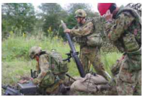
副砲手による弾込め