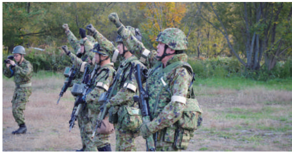
最先任の先導で関の声を上げ士気を鼓舞