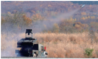
中距離多目的誘導弾の射撃