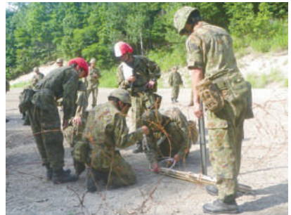
急造破壊筒の設置