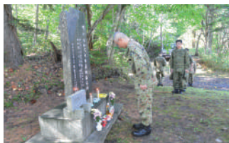
西岡演習場隣接の慰霊碑参拝

各慰霊碑に参拝した隊員はそれぞれ殉職者に思いを馳せるとともに、西岡演習場隣接地の慰霊碑は昭和53年に、また、紅桜慰霊碑は平成4年に、それぞれ土地所有者の善意により建立され現在まで維持・管理