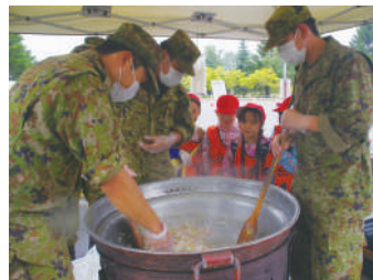
野外炊具による炊き出し実演

9月12日(火)、札幌ドームの駐車場地域で開催された「東月寒童夢セーフティフェスタ2023」に協力した。本イベントは、子供達が地域災害への防災運動を身近に感じ、楽しく学べることを目的として、途中コロナ禍で中断はあったものの、地域の施設や企業の協力を得て、平成23年から毎年行われているものであり、今年で13回目の開催となった。連隊は、豊平区を隊区とする第2普通科中隊を基幹に約30名をもって2校の小学生約200名に対し、災害用ドローンの展示や人命救助システム器材の操作体験、野外炊具による炊き出し実演等、陸上自衛隊の「防災」に関する各種体験や展示を行った。天候不良で中断を止む無くされたものの、ゲリラ豪雨の状況下で関係各機関との更なる連携強化を図ることができたとともに、装備品展示や体験搭乗等を通じて防災を楽しく学んでもらい、自衛隊の魅力を発信することができた。