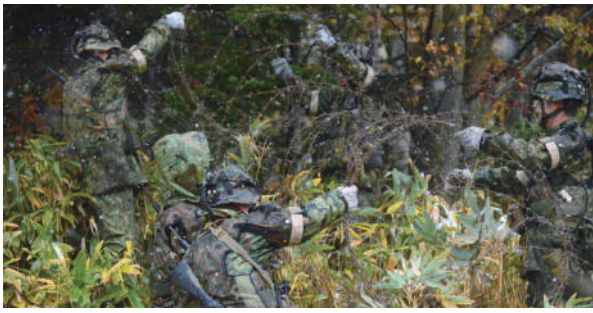
力を合わせて鉄条網の構築

連隊は、10月10日（火）から10月21日（土）までの間、「令和5年度連隊訓練検閲」を受閲した。 上富良野演習場において配属・協同部隊と共に増強第18普通科連隊として出陣式を行い最先任及び中隊前任上級曹長先導の下、基本基礎五訓の唱和等を実施した後連隊長訓示では「指揮の要訣の実践」「敵を意識した行動の確行」「安全管理」の三点を要望事項として掲げるとともに、作戦名「ペベルイの幻影作戦」へ神出鬼没に行動し敵を撃滅せんと示し士気を鼓舞した。 雪が深々と降り積もる厳しい寒さの中、敵の侵攻を阻止・撃破するべく各中隊はそれぞれ与えられた任務を遂行、各中隊の陣地を守り抜き連隊は見事に与えられた任務を完遂した。