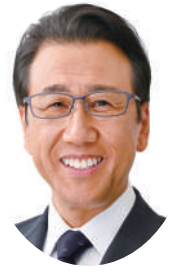
札幌市 市長 秋元 克広

新年明けましておめでとうございます。年頭にあたり、謹んでご挨拶申し上げます。陸上自衛隊第十八普通科連隊の皆様におかれましては、道民、市民の生命と財産を守るため、日頃より厳しい訓練に励まれていることに深く敬意を表します。自衛隊の皆様には、札幌市の様々な行事や災害対応に多大なるご尽力をいただいておりますが、新型コロナウイルス感染症の影響により、縮小、中止が続いております。第十八普通科連隊の皆様のご協力もあり、昨年は4年 また、札幌市が世界に誇る冬のイベントである「さっぽろ雪まつり」におきましては、昨年は3年ぶりの会場開催となり、自衛隊の皆様には、精巧かつ壮大な大雪像を制作していただき、多くの市民や観光客に喜んでいただくことができました。今後も来場者に大きな感動を与えることができるようご協力をよろしくお願い申し上げます。 結びに、自衛隊と自衛隊協力会の皆さま並びにご家族の方々の今年一年のご多幸とご健勝を心からお祈り申し上げます。年頭のご挨拶とさせていただきます。