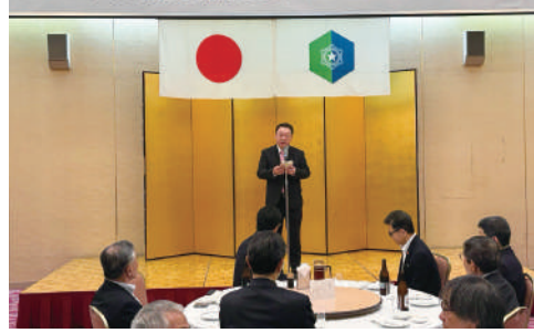
札幌市自衛隊協力会 定期総会 懇親会

自衛隊協力会は、自衛隊の活動を理解し協力するとともに、駐屯地等自衛隊施設の見学や定期総会等を通じて、自衛隊との交流を深めている。構成は各地域毎に分かれ、道内の様々な駐屯地、航空基地等に足を運び、駐屯地での史料館の見学を始め、ヘリコプター、車両等の体験搭乗及び隊員食堂での喫食等、様々な視点から見学をして、自衛隊の活動への理解を深めている。入会についてはどなたでも可能となっている。 問い合わせ先は本紙8面参照