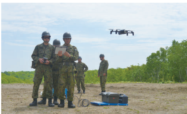
ドローン操作訓練

連隊は、5月15日(木)から5月22日(木)までの間、「令和7年度連隊ドローン操作訓練」を実施した。ドローンに関する基礎知識及び基本・応用操作要領について演練した被教育者は、引き続き練度向上に努めるとともに、指導者要員として各中隊の隊員に普及し、連隊のドローン操作技術の向上を目指す。