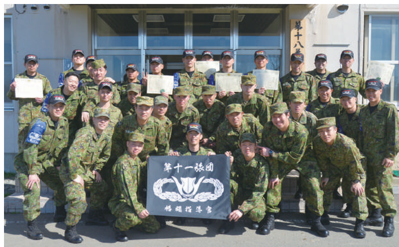
教官・助教の集合写真