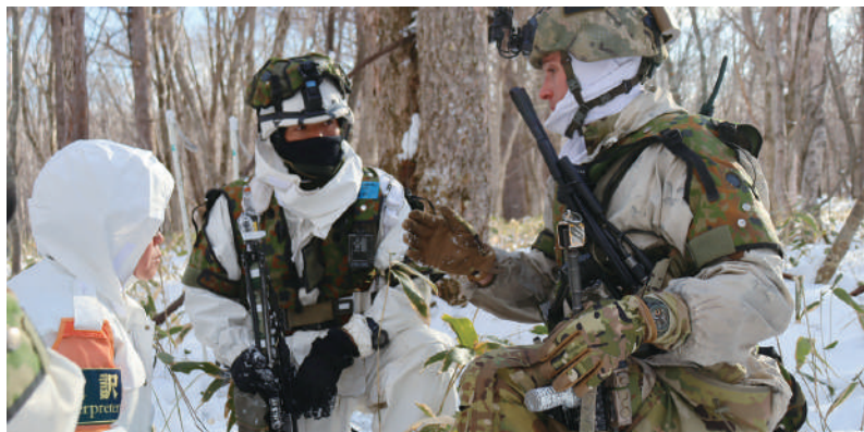
米軍との現地調整

令和6年、連隊創立70周年の節目において、あらためて連隊独自のキャッチフレーズを募集し、集まった16の候補の中から所属全隊員で投票を行い決定したものである。