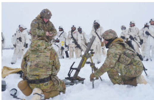
迫撃砲非実射訓練