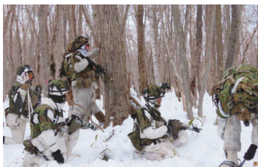
米軍との共同戦闘