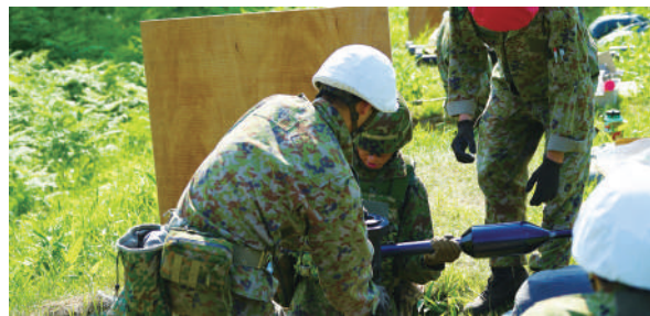
110mm個人携帯対戦車弾