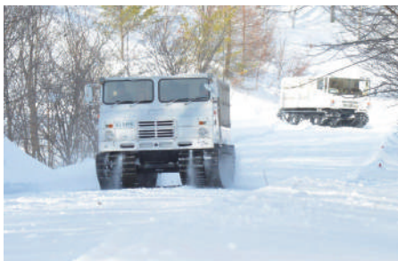
雪上車による人員輸送