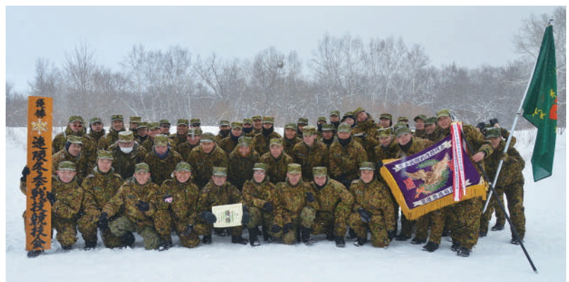
優勝した本部管理中隊

連隊は、3月7日(金)北海道大演習場西岡地区において、連隊冬季戦技競技会を実施した。 本競技は、スキー滑走、かんじき、アキオ曳行の走法があり、リレー方式で各中隊対抗で行った。 各中隊は、日頃からの練成成果を発揮し団結して競い合い、本部管理中隊が見事優勝した。