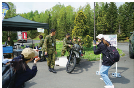
偵察用オートバイ

連隊は、5月17日(土)から5月18日(日)までの間、滝野すずらん公園で行われた「たきのアウトドアピクニック2025」において、軽装甲自動車と偵察用オートバイの装備品展示を行いました。園内の花々が見頃を迎えるなか、多くの方々が来場されました。本イベントの支援をした隊員は、来場者と交流する良い機会となりました。