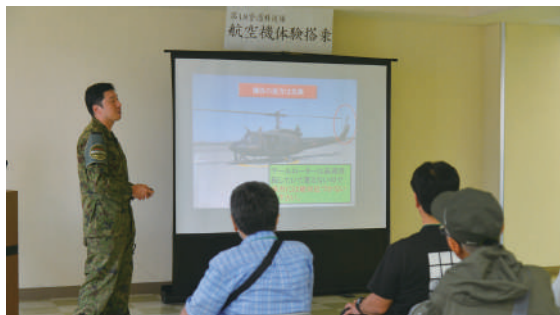
第11飛行隊による安全教育

連隊は、6月21日(土)に真駒内駐屯地着陸場において、航空機体験搭乗を実施した。関係団体の方々、防衛モニター及び高校生等が参加し、ヘリコプター(UH-1J)に搭乗した。札幌市上空を自衛隊機にて飛行を体験してもらい、より自衛隊への理解と認識を深めた。