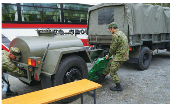
水トレーラの設置