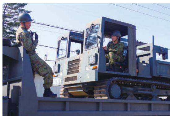
資材運搬車の積載