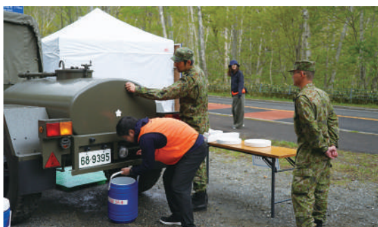
スポーツ協会と連携し準備