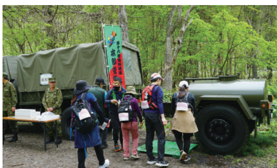
水トレーラーを利用する参加者

連隊は、5月18日(日)に札幌市スポーツ協会主催で開催された札幌市真駒内から国立公園支笏湖までを歩く民間イベント「第48回北海道を歩こう」において、給水支援を実施した。当日はイベント中に雨天となったが、約1000名の応募者が参加し、連隊がコース上の休憩地点に水トレーラで準備した水は、参加者の飲用やうがい等に利用されゴールを目指す活力となった。陸上自衛隊の隊員及び装備品等を間近で見てもらったり、触れ合ってもらうことができ、広報効果の獲得にも繋がった。