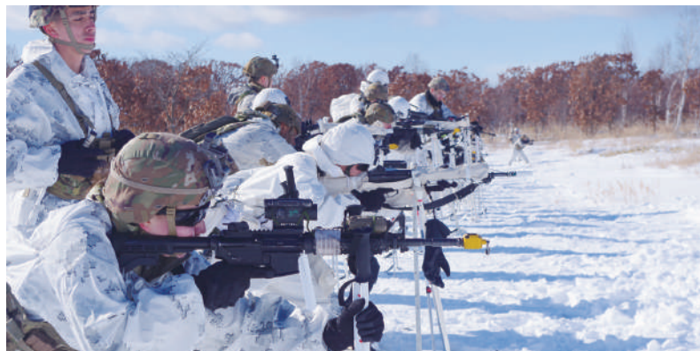
ストックを利用した射撃