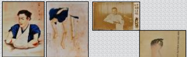
刀傷の図 鉄砲傷の図 八甲田雪中行軍遭難事件 (神風連の乱) (西南戦争) (凍傷の図)

(初代医務局長) (第2代医務局長) (第5代医務局長) (第8代医務局長) (第3代医務局長) 揮毫：中丸清十郎 揮毫：吉田栄一 揮毫：吉田栄一 揮毫：中丸清十郎