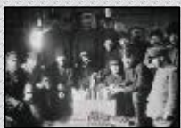
習志野捕虜収容所写真 (日露戦争)