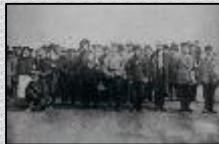
露軍赤十字病院写真 (日露戦争)