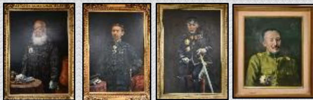
松本良順 林紀 石黒忠憲 森林太郎