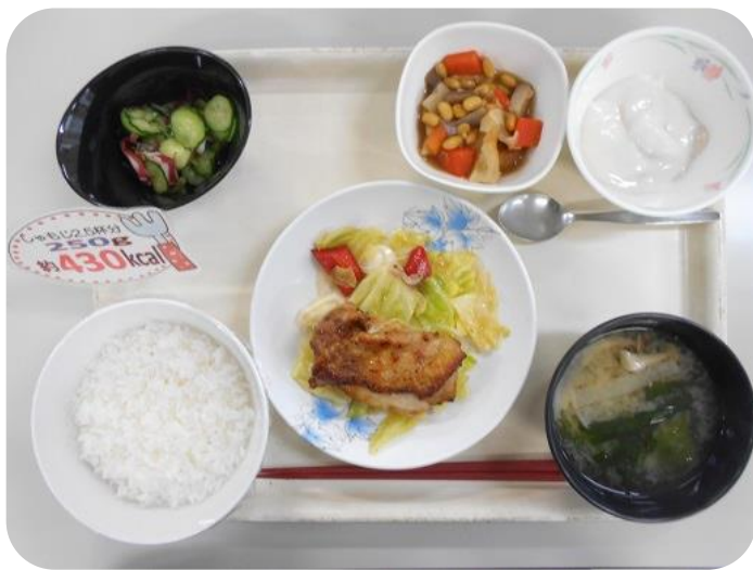
2 / 5 (月) 昼

味はもちろんのこと、視覚でも楽しませてくれる食堂のごはんですが、今月は「彩り」にご注目ください。茶色に偏りがちな主菜も食堂に任せればこの通り✨