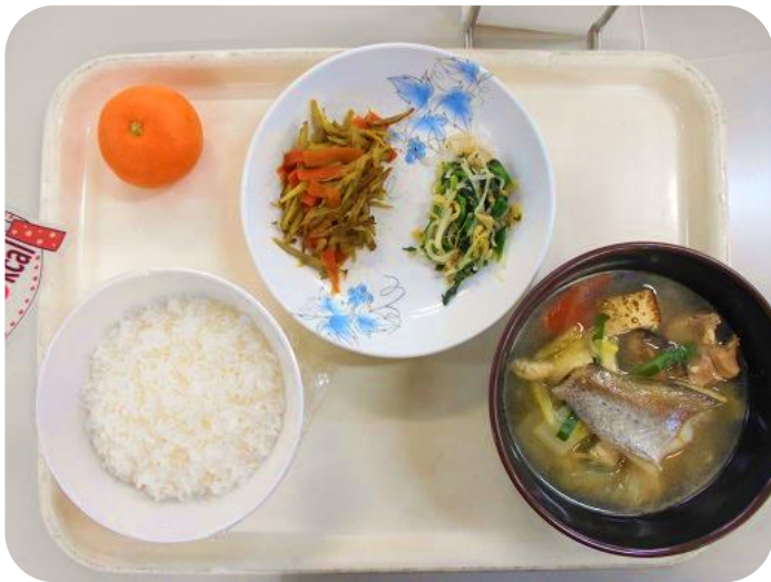
2 / 7 (水) 夕