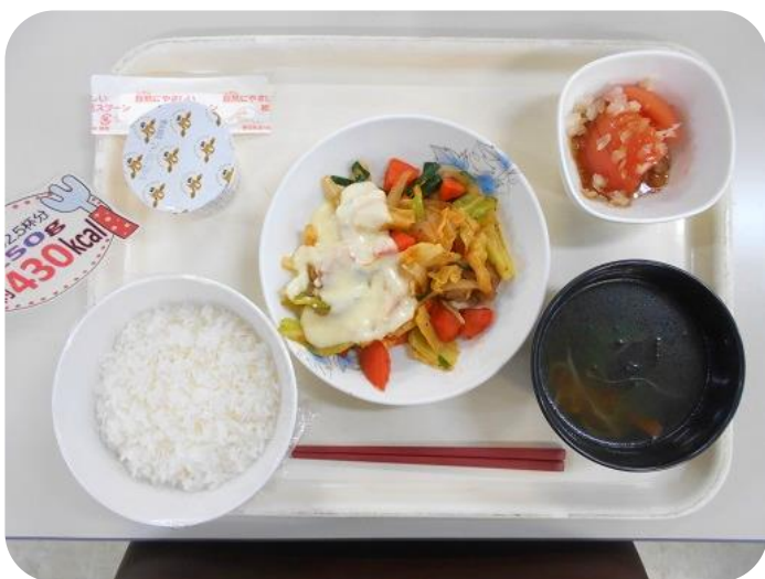
2 / 8 (木) 夕