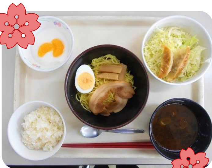
2 / 6 (火) 昼