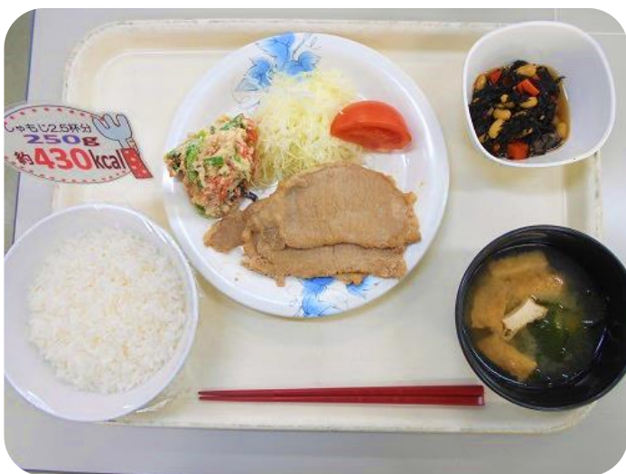
2 / 9 (金) 夕