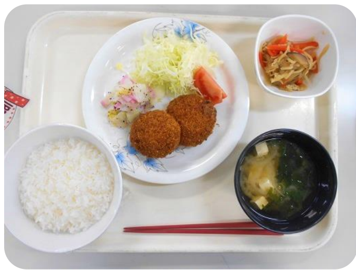
2 / 5 (月) 夕