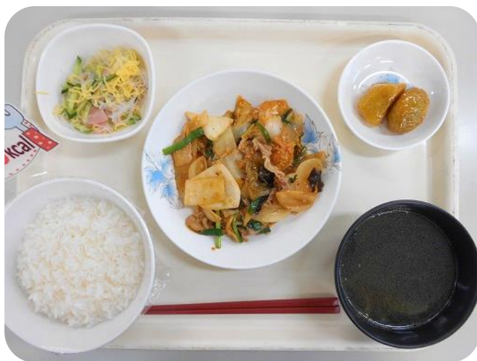
2 / 6 (火) 夕