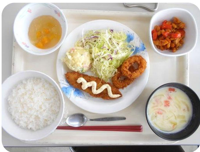
2 / 8 (木) 昼