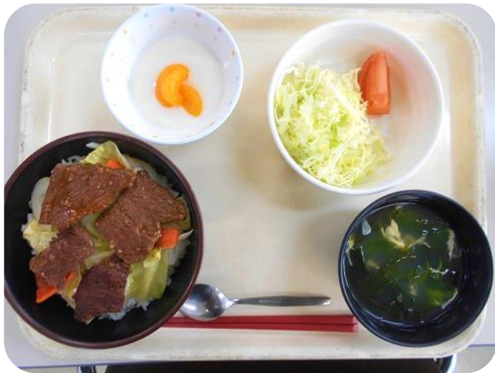
2 / 7 (水) 昼