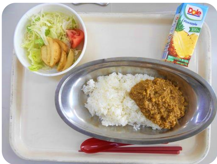
2 / 9 (金) 昼