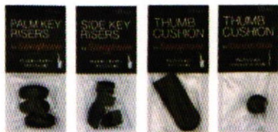
バームキーライザー サイドキーライザー サムクッション サムクッション