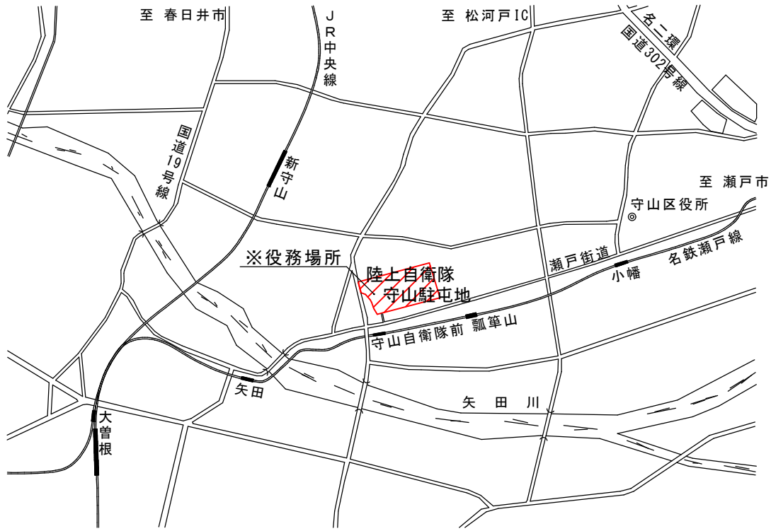
守山駐屯地案内図