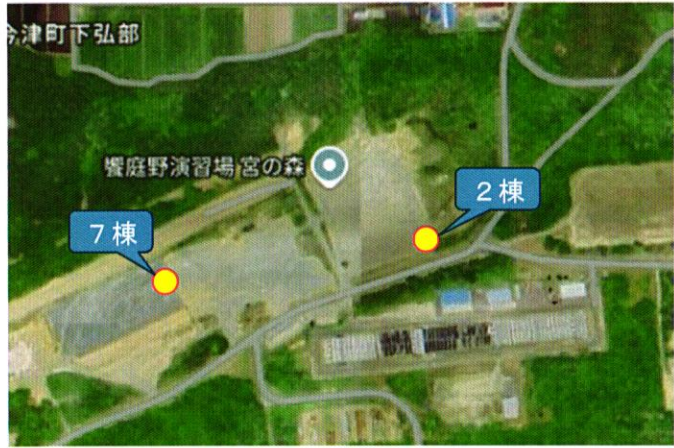
① 宮の森 9棟 (7棟、2棟)