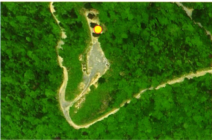
② 小俵山 2棟