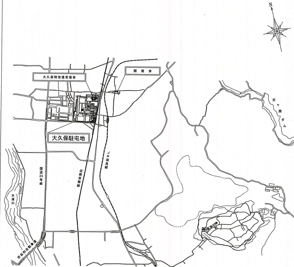
駐屯地案内図 (S=1 : 45000)