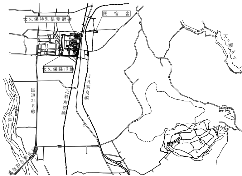
案内図 S = N, S