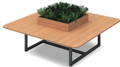
※画像はイメージです。実際の商品とデザイン・仕様の一部異なる場合がございます。