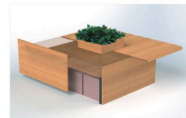
収納スペース パネルタイプは内部に防災時の備蓄用品等を収納できる構造です。