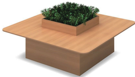
※画像はイメージです。実際の商品とデザイン・仕様の一部異なる場合がございます。