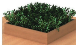
プランター(オプション) 中心に植栽のためのプランターを設置することができます。