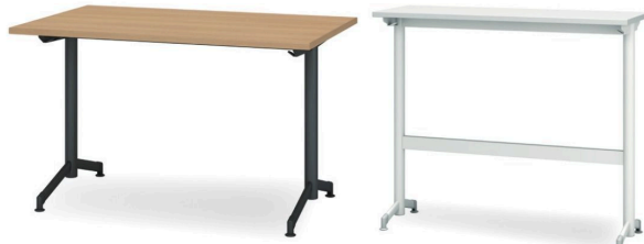
T字脚スクエア天板