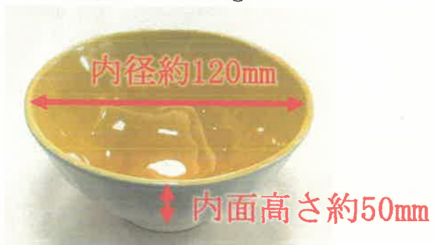
(1) 御飯茶碗中 150g