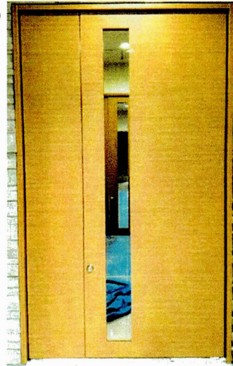
親子扉の塗装色 木目調（ナチュラルオーク系）