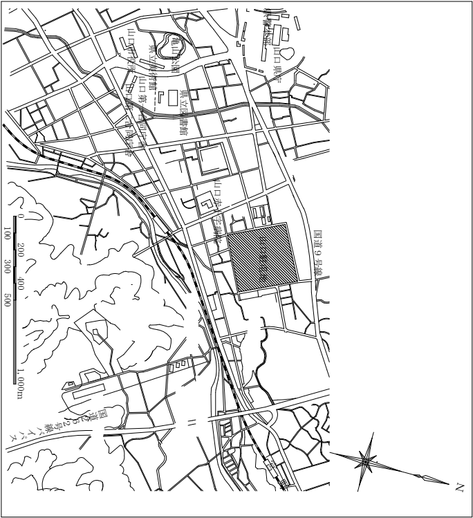
案内図 S : 1 / 2 0 0 , 0 0 0