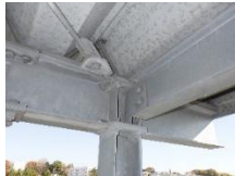
各階にある ボルト締め 点検整備