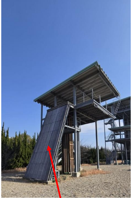
登はん部分の洗浄および 防腐剤の塗りつけ（両面）