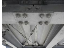
地面から 2階まで 7.000