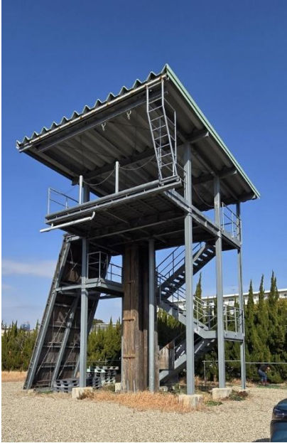
地面から 屋根まで 9.750